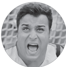
احسان حدادی؛ هفتم رسیدن به پنجمین مدال طلای آسیاست

فارس/ شبکه «الرابعه» عراق خبر داد، علی یوسف مهاجم باشگاه الزوراء با باشگاه صنعت نفت آبادان قرارداد امضا کرد و راهی لیگ ایران شد. پیش از این اعلام شده بود مدیرعامل باشگاه صنعت نفت آبادان برای مذاکره با سه بازیکن عراقی (فهد طالب، دروازه‌بان ملی پوش تیم ملی عراق، میثم جبار و علی یوسف) مدنظر ویسی به این کشور سفر کرده است. حال از بین سه بازیکن باشگاه صنعت نفت آبادان با علی یوسف قرارداد امضا کرده است.