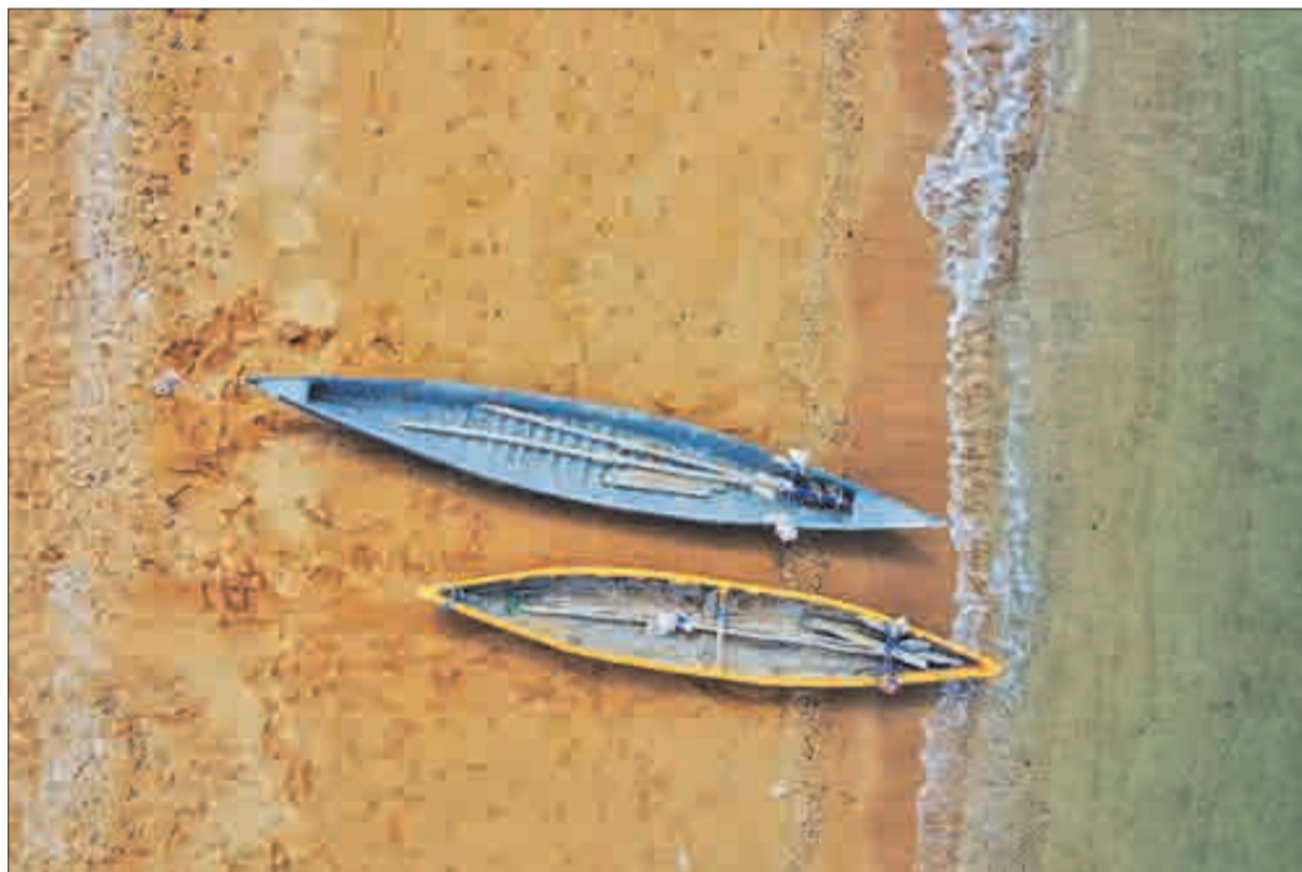
▶ ساحل جزیره قشم