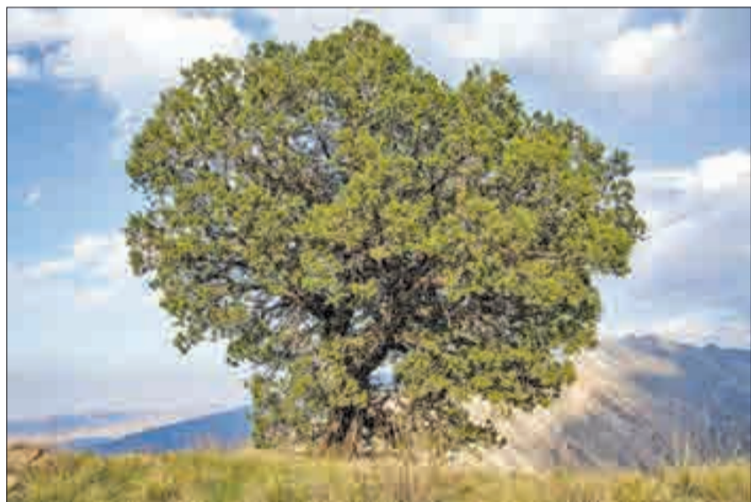
▲ درخت ارس