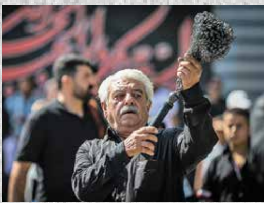
نماز ظهر عاشورا جانبازان هیأت «قمر بنی هاشم» تهران