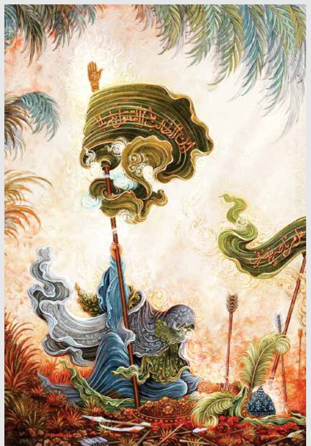
رضا پدرالسماء / نقاش و نگارگر