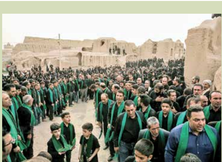
آیین عزاداری زارخاک در روستای قورتان اصفهان

هیأت‌های سینه‌زنی و زنجیرزنی با حضور در کانون‌های شیطان‌ی عوامل صهیونیسم بین‌الملل و اهانت به ساخت مقدس قرآن و کلام الهی، عزاداران حسینی قبل از اقامه نماز، با در دست داشتن قرآن کریم، ندای لیلیک یا قرآن، لیلیک یا حسین، لیلیک یا زینب و لیلیک یا خمنه‌ای سر دادند و این اقدام ننگین و اهانت‌آمیز به قرآن را