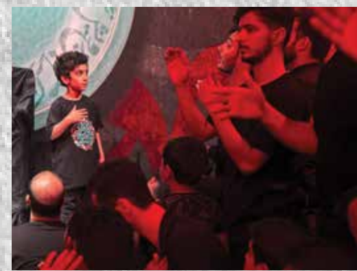
آیین سوگواری در صحرا، در این مراسم گروهی از مردم عزادار امام حسین (ع) به صحرایی در نزدیکی سمنان می‌روند و به عزاداری و سوگواری می‌پردازند.