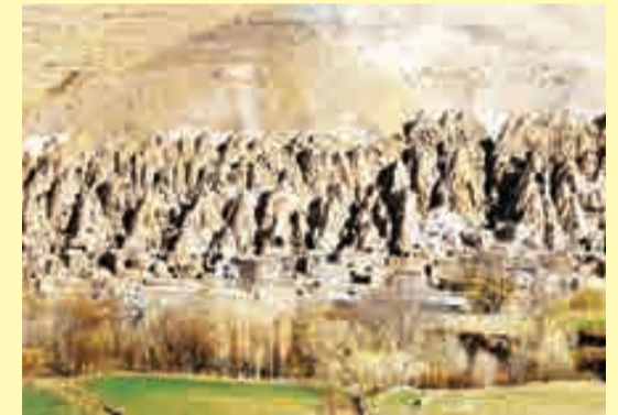
Kandovan Village UNWTO

The selected villages that will participate in the global competition are Kandovan in East Azarbai-