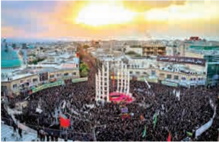
People mourning for the martyrdom of Imam Hussein (PBUH) in a square located opposite to Hosseinih Azam Mosque