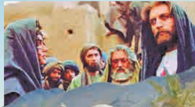
فیلم محمد رسول الله