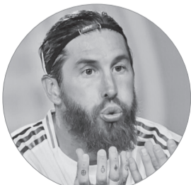
راموس؛ در جمع بارسایی‌ها!