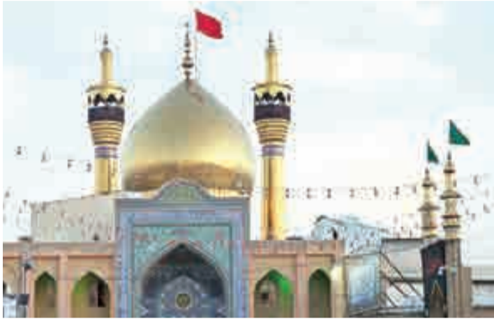
Hosseinih Azam Mosque IRNA