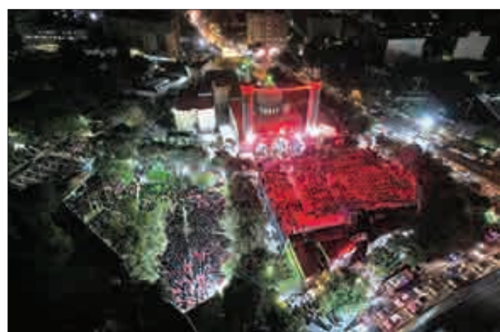
▲ خیمه عاشورایی میدان هفت تیر تهران