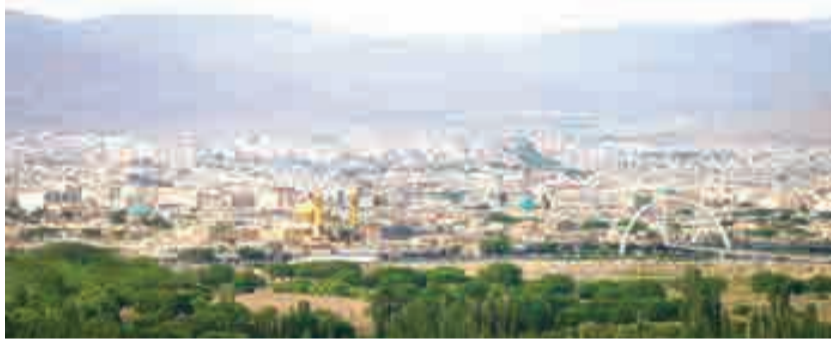
An overview of Zanjan

ince's Cultural Heritage, Tourism and Handicrafts Organization said that this type of tourism not only brings economic benefits but also has great spiritual value. He said that when Muharram (the first month of the lunar calendar) arrives, local people hold various traditional religious ceremonies relating to the martyrdom of Imam Hussein (PBUH) and his companions. He noted that a large number of the true lovers of Imam Hussein travel to Zanjan Province