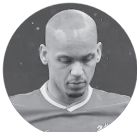
فابینیو؛ به خاطر سگ‌هایش به دردسر افتاد

ایسنا/ راموس از لیگ برزیل و عربستان پیشنهادهای خوبی داشت اما قصد ندارد راهی این دو کشور شود، چرا که تصمیم نهایی این مدافع باتجربه لیگ امریکاست. طبق اعلام روزنامه اسپورت اسپانیا، بازیکن سابق رئال مادرید مذاکرات خوبی با باشگاه اینترمیامی آمریکا داشته است و با این تیم برای فصل بعد به توافق رسیده است. این مدافع باتجربه دو فصل با مسی در پاری سن ژرمن هم‌تیمی بود.