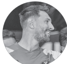
مسی؛ اینترمیامی را ۱۱/۶ میلیون فالوئری کرد

ایرنا/ قرارداد مهاجم برزیلی لیورپول با الاتحاد به دلیل اینکه سگ‌های خطرناکش اجازه ورود به عربستان را ندارند، به مشکل خورده است. فابینیو صاحب یک جفت بولدگ فرانسوی است و به دلیل قوانین حیوانات عربستان سعودی، این نژاد از نوع تهاجمی و خطرناک است و ورود این نژاد به عربستان تحت هر شرایطی ممنوع است. به همین دلیل انتقال مهاجم پرتغالی لیورپول به تیم الاتحاد عربستان با یک مشکل عجیب روبه‌رو شده است.