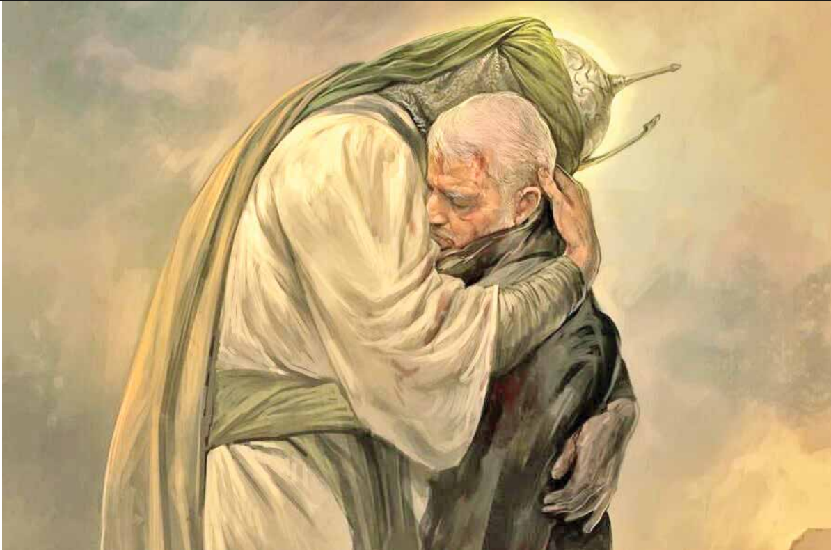
تابلوی نقاشی «اصحاب آخرازماتی اباعبدالله» اثر حسن روح الامین