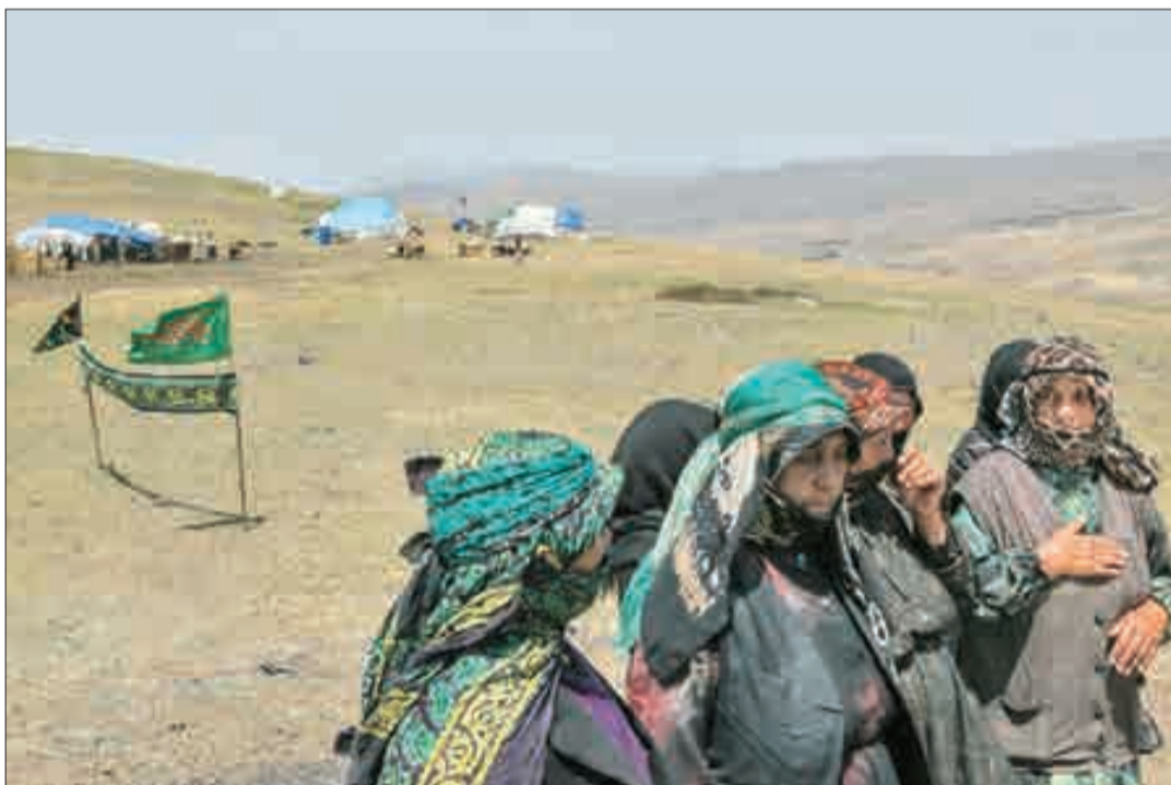
▲ عزاداری عشایر آذربایجان