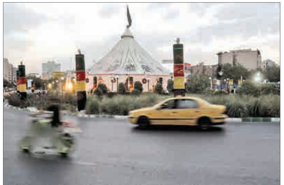
▲ خیمه عاشورایی میدان هفت تیر تهران