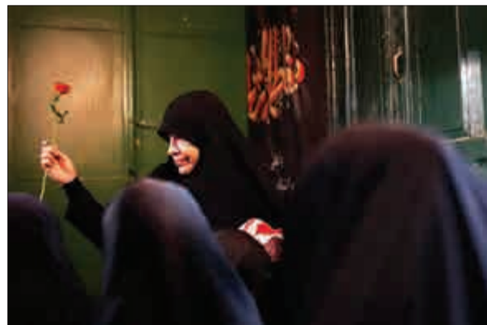
▲ حسینیه سادات اخوی تهران