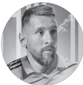
مسی؛ جواب پادشاه را داد

بود که باشگاه اتحاد کلباء در صفحه رسمی خود تصویری مبهم را منتشر و اعلام کرد که به زودی از بازیکن جدید خود که شماره ۱۰ برتن می‌کند، رونمایی خواهد کرد. تصویر مبهمی که تیم تحت هدایت فرهاد مجیدی در صفحه اینستاگرامی‌اش منتشر کرده، خیلی‌ها را یاد مهدی قایدی و شادی گل‌های معروف او با پیراهن استقلال می‌اندازد و همین مساله سبب شده تا خیلی‌ها تصور کنند قایدی به زودی با پیراهن اتحاد کلباء معرفی خواهد شد. اگرچه تصویر منتشر شده در صفحه رسمی باشگاه اتحاد کلباء واضح نیست اما شکل و شمایل این تصویر مبهم برای استقلالی‌ها یاد آور یک صحنه آشنا است؛ شادی گل‌های مهدی قایدی.