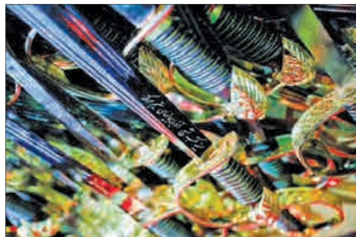
آیین شاه حسین گویان ▲