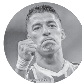
سوارس؛ برای پیوستن به مسی از همه چیز گذشت

الکس تلس، مدافع چپ برزیلی تیم فوتبال منچستر یونایتد با عقد قراردادی به‌صورت رسمی به تیم فوتبال النصر عربستان پیوست و همبازی کریستیانو رونالدو، مارسلو برونوویچ و سکو فوفانا شد. منچستر یونایتد ۴ میلیون پوند از فروش این بازیکن دریافت خواهد کرد و دستمزد تلس نیز سالانه ۷ میلیون دلار خواهد بود. تلس ۳۰ ساله در تابستان ۲۰۲۰ از پورتو راهی یونایتد شد.