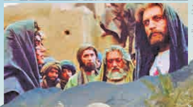
فیلم محمد رسول الله