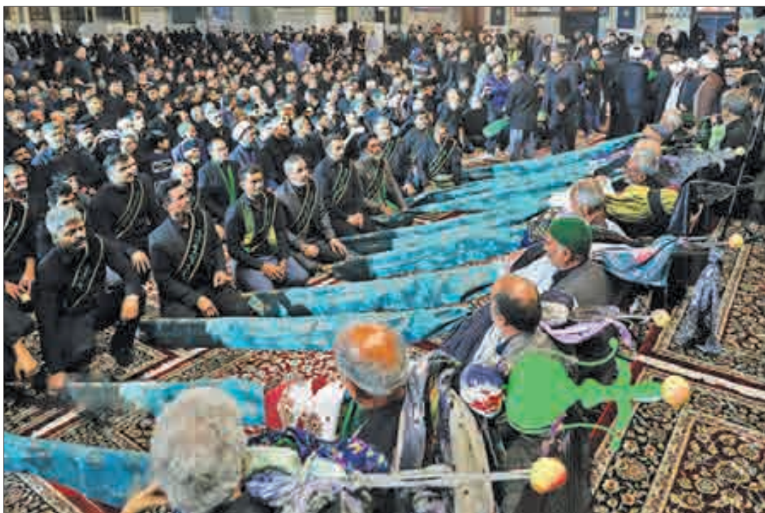
▲ عزاداری محرم در حسینیه حرم