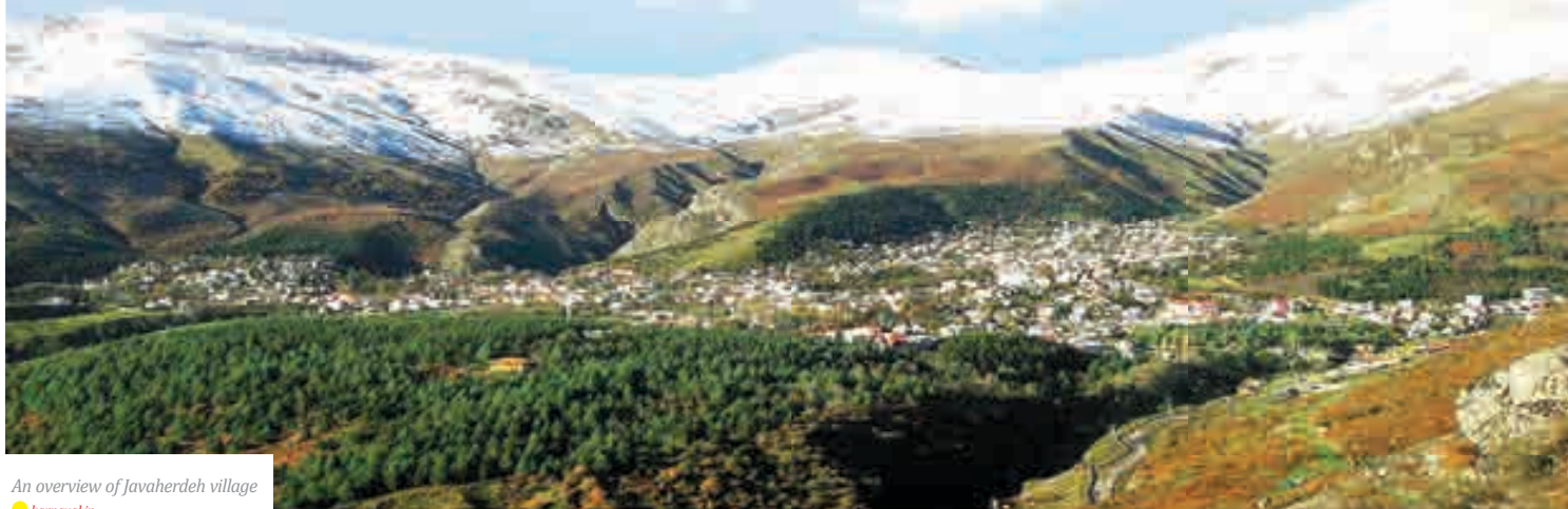
An overview of Javaherdeh village karnaval.ir