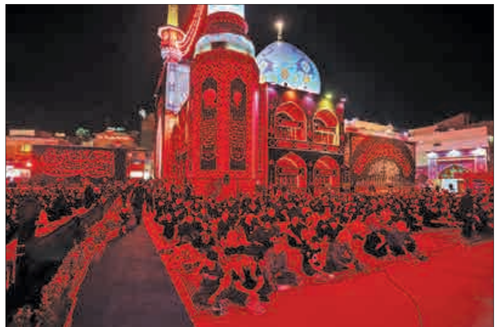
▲ عزاداری محرم در امامزاده صالح(ع)