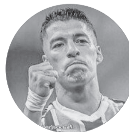
سوارس؛ برای پیوستن به مسی از همه چیز گذشت

الکس تلس، مدافع چپ برزیلی تیم فوتبال منچستر یونایتد با عقد قراردادی به‌صورت رسمی به تیم فوتبال النصر عربستان پیوست و همبازی کریستیانو رونالدو، مارسلو برونوویچ و سکو فوفانا شد. منچستر یونایتد ۴ میلیون پوند از فروش این بازیکن دریافت خواهد کرد و دستمزد تلس نیز سالانه ۷ میلیون دلار خواهد بود. تلس ۳۰ ساله در تابستان ۲۰۲۰ از پورتو راهی یونایتد شد.