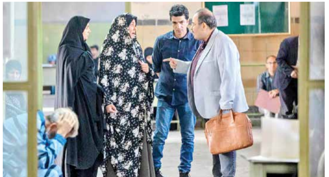
وجه تمایز نیکان با دیگر سریال‌ها

نرم می‌کند، باید نگرانی مسئولیت‌بردار کوچک خود را نیز اضافه کند، موقعیتی دراماتیک ایجاد کرده است که مخاطب با آن همدات‌پنداری می‌کند و برای آنچه که شخصیت اصلی قصه دنبال می‌کند، انتظار می‌کشد و همین امر نشان می‌دهد عوامل سازنده سریال بخوبی از پس تعلیق و کشش در داستان برآمده‌اند. گویی اولویت‌های زندگی دخترک جوان قصه تغییر کرده است و او که پیش از این برای دستیابی به آرزوهایش با تکیه بر ثروت و دارایی و مقام و منزلت پدر و مادرش، آن‌سوی مرزها را هدف گرفته بود، اکنون برای رسیدن به مقصد باید نگاهش را به زندگی و پیرامون خود عوض کرده و روی پاهای خودش بایستد و آن بلایی که به