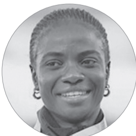
آموسان؛ نقض قوانین ضد دوپینگ

این درحالی است که این مهاجم فرانسوی نمی‌خواهد قراردادش را تا سال ۲۰۲۴ تمدید کند، تا سال آینده به صورت رایگان از پاری سن ژرمن راهی رئال شود. ولی باشگاه پاریسی به هیچ وجه این ضرر بزرگ اقتصادی را قبول نمی‌کند. به نظر می‌رسد مدیران پی اس جی از هر ابزاری حتی نیمکت نشینی امباپه استفاده می‌کنند تا این ستاره تسلیم خواسته‌های باشگاه شود، قطعاً نیمکت نشینی یک فصل او به منزله نابودی‌اش خواهد بود.