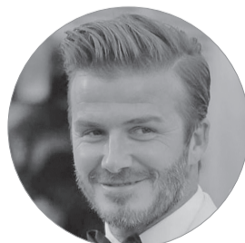
بکام؛ به مسی زمان بدهید

تسنیم/ توبی آموسان، ورزشکار نیجریه‌ای که فصل گذشته رکورد جدیدی در ماده ۱۰۰ متر بامانع زنان جهان ثبت کرد، به نقض قوانین ضد دوپینگ متهم شده است. وی در صفحه اجتماعی‌اش نوشت: سازمان مستقل مبارزه با دوپینگ در دوومیدانی من را به اتهام نقض قوانین ضد دوپینگ به دلیل از دست‌دادن سه آزمایش در طول ۱۲ ماه متهم کرد. قصد ندارم به این اتهام اعتراض کنم و امیدوارم در مسابقات جهانی که از ماه اوت آغاز می‌شود، حضور یابم.