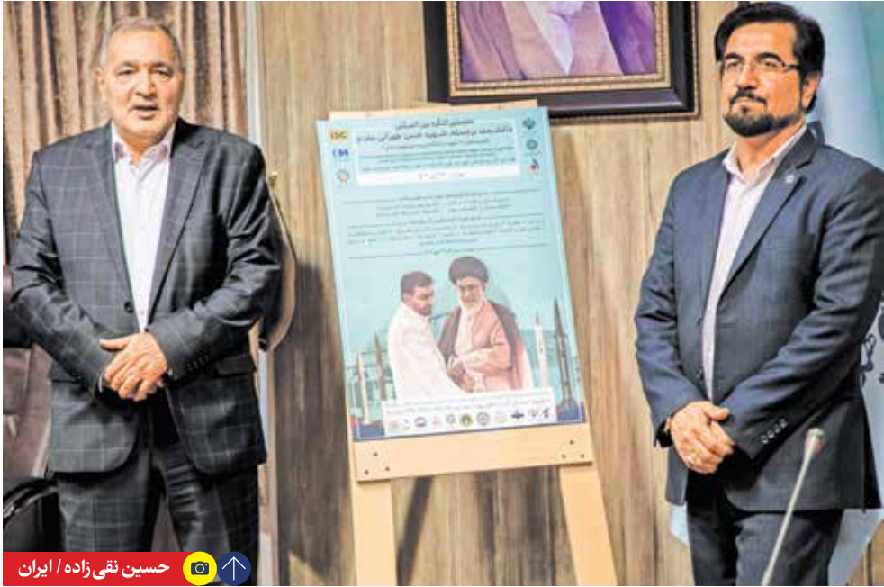
حسین نفی زاده / ایران

وی با اشاره به امضای تفاهنامه دارویی با تاجیکستان گفت: تفاهنامه دینیب با وزیر بهداشت تاجیکستان، گامی بزرگ در عرصه صادرات دارو به این کشور است؛ پیش از این دیوان سالاری و ضوابط دست و پا گیر اجازه صادرات داروی ایران را با قیمت مناسب به تاجیکستان نمی‌داد، اما اکنون با این تفاهنامه گام بزرگی در صادرات دارو از ایران به تاجیکستان برداشته شد. وزیر بهداشت افزود: بر اساس این تفاهنامه، دولت تاجیکستان بازار دارویی ایران را به رسمیت می‌شناسد و از این پس بازار دارویی خوبی در این کشور پیش روی ایران خواهد بود. عین‌اللهی گفت: همچنین تفاهنامه‌ای در زمینه تبادل استاد و دانشجویان تحصیل دانشجویان پزشکی تاجیکستان در ایران زیر نظر استادان ایرانی به صورت کوتاه مدت، میان مدت و درازمدت منعقد شد و دانشگاه علوم پزشکی شهید بهشتی به عنوان دانشگاه مقیم در این کشور معرفی شد.