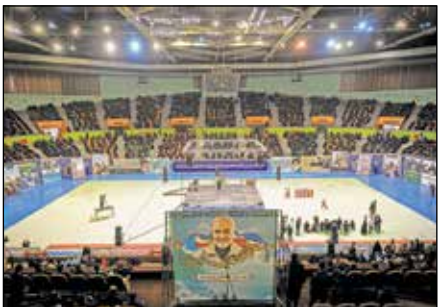
همایش «دختران حاج قاسم» برگزار شد