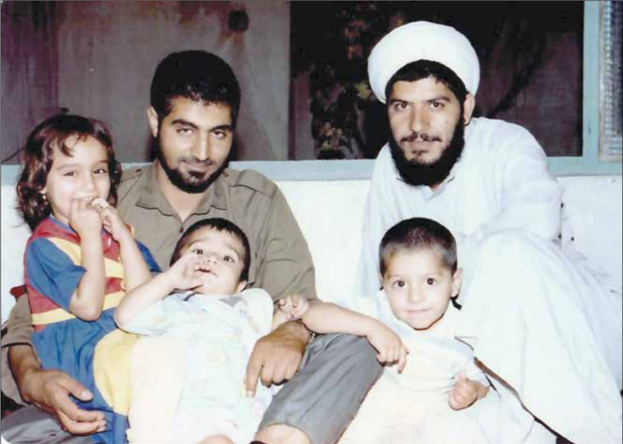
«علی شیرازی(راوی کتاب) و شهید قاسم سلیمانی»

مخاطب این کتاب عام‌است، همه‌مردمی که آن تشییع‌تاریخی بزرگ‌ار رقم‌زدندکه‌عنوان آن‌را «حماسه‌تشییع» گذاشتم.