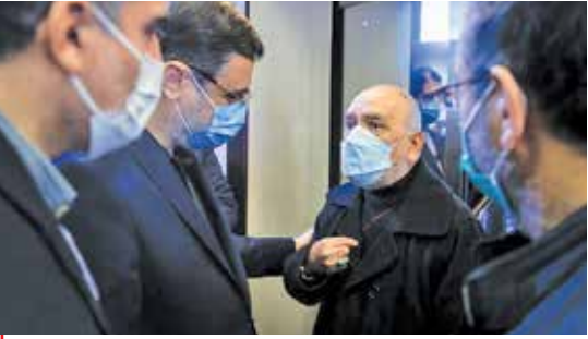
گفت و گوی خانواده یکی از شهدای حادثه هواییمای اوکراینی با رئیس بنیاد شهید

به گزارش فارس، رئیس بنیاد شهید و امور ایثارگران روز گذشته در این مراسم ضمن تشکر از خانواده معزز و معظم شهدای این حادثه گفت: زنده نگه داشتن یاد شهدا و خدمت به خانواده شهدا وظیفه ذاتی بنیاد شهید و امور ایثارگران است و در این راستا در هفته جاری مراسم گوناگونی برای گرامیداشت شهدای هواییمای اوکراینی برگزار شد.