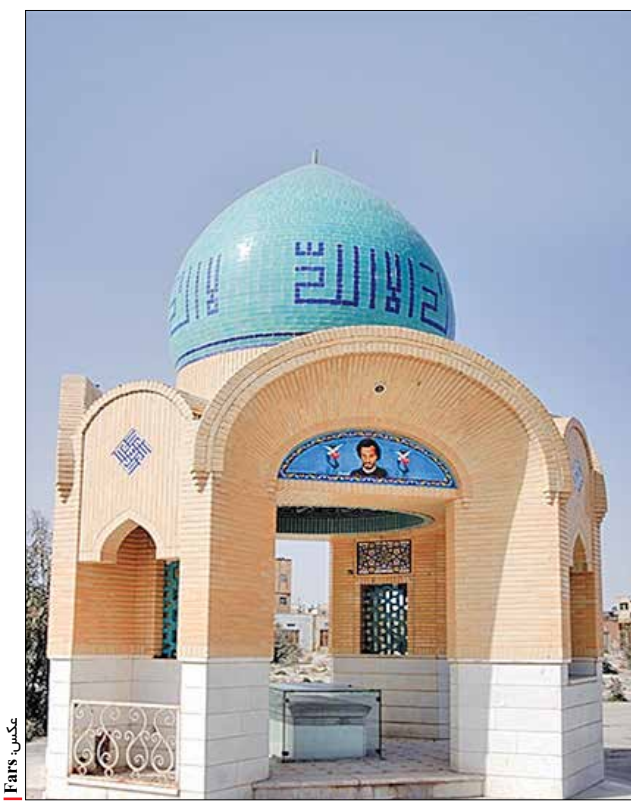
آرامگاه شهید نواب صفوی، تدفین بیکر شهید نواب صفوی ابتدا در روستای مسگر آباد (واقع در شرق تهران) انجام شد اما بعدها با اجازه مجدد نemat توسط این مرجع عالیقدر، به قم منتقل و در قبرستان وادی‌السلام این شهر خاکسپاری شد.

چند کیلومتر از شهر دور نشده بودیم که مردی تنومند از اعراب، خنجر به دست راهمان را بست و گفت: پول و جواهر هر چه داریز رو کنی. داشتیم پول هائیم را درمی‌آوردیم که ناگهان سید با چالاکي عجیبی، خنجر عرب را گرفت و با سرعت، نوک آن را نزدیک گلوئی مرد گرفت و رعدآسا فریاد زد: با خدا باش و از خدا ترس!... چند لحظه گذشت و مرد عرب، در عین ناباوری تسلیم شد. سید، خیلی آرام خنجر را کنار گرفت و رو به من گفت: برویم؟! در این فکر بودم یعنی چه که دزدی را همینطور رها کنیم، که مرد عرب پیش آمد و با سرفرآکندهی ما را به خیمه اش دعوت نمود از تعجب و شگفتی دیگر نمی‌فهمیدم چه خبر است، فقط شنیدم که نواب فوراً نپذیرفت و گفت: اینجا عرب هستند و به میهمان ارج می‌نهند، خیالت راحت باشد.»! همین روحیه شجاعانه در طول دوران مبارزه با طاغوت و مقام‌های رژیم وابسته پهلوی مشاهده می‌شود. شجاعتی که دشمنان را به هراس می‌انداخت و دوستان را تحت‌تأثیر قرار می‌داد. او در کنار روحیه شجاعانه‌اش در میدان مبارزه، از منطق، بیان و استدلال بسیار قوی هم برخوردار بود. برای همین وقتی لب به سخن می‌گشود، همه را تحت‌تأثیر قرار می‌داد؛ سخنانش چون از دل برمی‌خاست، بر دل می‌نشست و تحولی آرز در فکر و اندیشه‌ها به‌وجود می‌آورد. ۴ بصیرت و بینش دقیق سیاسی از مهم‌ترین لوازم یک رهبر موفق، برخورداری از بصیرت و بینش دقیق سیاسی است. شهید نواب صفوی، اندیشه و بینش سیاسی دقیقی داشت که برگرفته از آموزه‌های قرآن کریم بود. خطر را از دور احساس می‌کرد و پیشاپیش برای مقابله با آن برمی‌خاست. برای همین، وقتی رژیم پیوستن ایران به پیمان «ستو» را که طرح آن از سوی آمریکا و انگلیس بر ایران تحمیل شده بود، شنید در صدد مقابله با عامل اجرایی آن یعنی حسین علا برآمد و