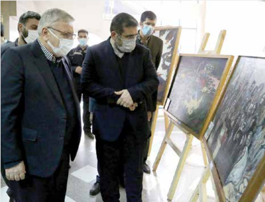
شهادت وزارت فرهنگ

وزیر فرهنگ و ارشاد اسلامی تأکید کرد: «بر این باورم که باید جریان فرهنگی و هنری را با استفاده از همه ظرفیت‌های ممکن پشت این کار آورده و با قدرت روایتگری جلوی دسیسه رسانه‌های غربی برای تحریف واقعیت را بگیریم.» وزیر فرهنگ و ارشاد اسلامی در ادامه با حضور در نمایشگاه هنرهای تجسمی که در حاشیه این همایش بزرگ برپا شده بود در جریان روند آثار ارائه شده قرار گرفت.