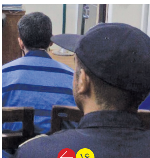
جسد این پسر ۴ ماه ناشناس بود

پسر جوان به میهمانی دعوت بود. بارها چنین قرارهایی داشت اما این بار باید به استقبال مرگی می‌رفت که نسخه‌اش را نوشته بودند. مرد جوان با همدستی چهار دوستش در اقدامی هولناک برادرزاده‌اش را در زیرزمین خانه قدیمی به قتل رساند.