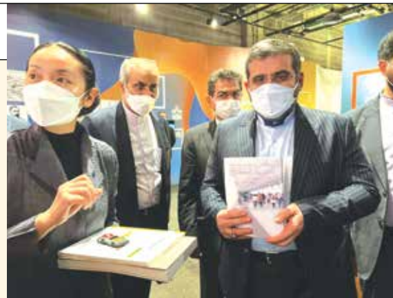
وزیر فرهنگ و ارشاد اسلامی در اکتسیو همواره آثار او را دنبال می‌کردم. نام نیکی استاد برآوازه حوزه علوم سیاسی روابط بین‌الملل برکتیبه دل همه دوستداران و شاگردان ایشان حک شده است.»

حقیقت بزرگداشت یادونام انقلاب است وزیر فرهنگ و ارشاد اسلامی استاد منوچهر محمدی را چهره علمی، انقلابی، فرهنگی، دغدغه‌مند، متخصص و متعهد که باید او را پیشگام و پیشرو در زمینه مطالعات انقلاب اسلامی دانست و گفت: «نکوداشت