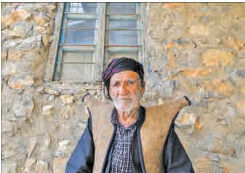
▲ روستای جهانی اورامان تخت