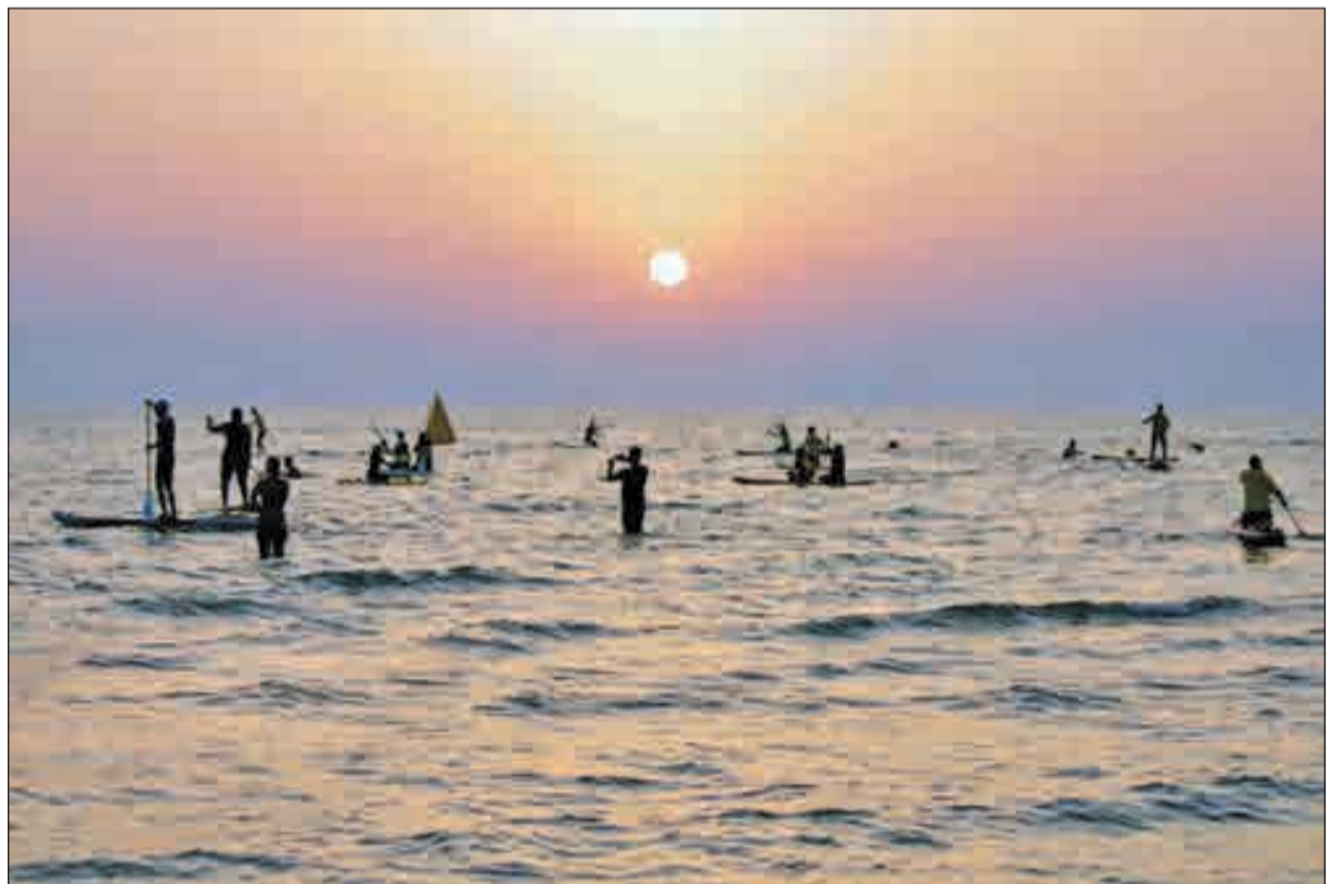
▲ جشنواره ورزش‌های دریایی و ساحلی در پوشهر