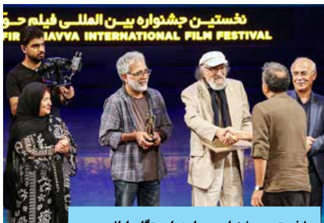
نخستین جشنواره بین‌المللی فیلم حور