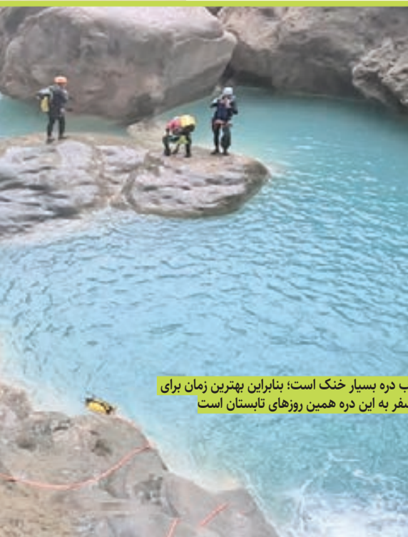
آب دره بسیار خنک است؛ بنابراین بهترین زمان برای سفر به این دره همین روزهای تابستان است

گردشگران خارجی عشایری بیشتر از کشورهای چین، لهستان، روسیه و ترکیه هستند. چون ما از ایل قشقای هستیم، زبان ترکی را خوب می‌دانم. انگلیسی را هم تا حدی یاد گرفته‌ام و برای ارتباط با گردشگران خارجی احتیاجی به لیدرها ندارم. ما در برخورد با گردشگران همان‌گونه رفتار می‌کنیم که خود واقعی‌مان هستیم و از آنها هم می‌خواهیم که فرهنگشان را به ما تحمیل نکنند