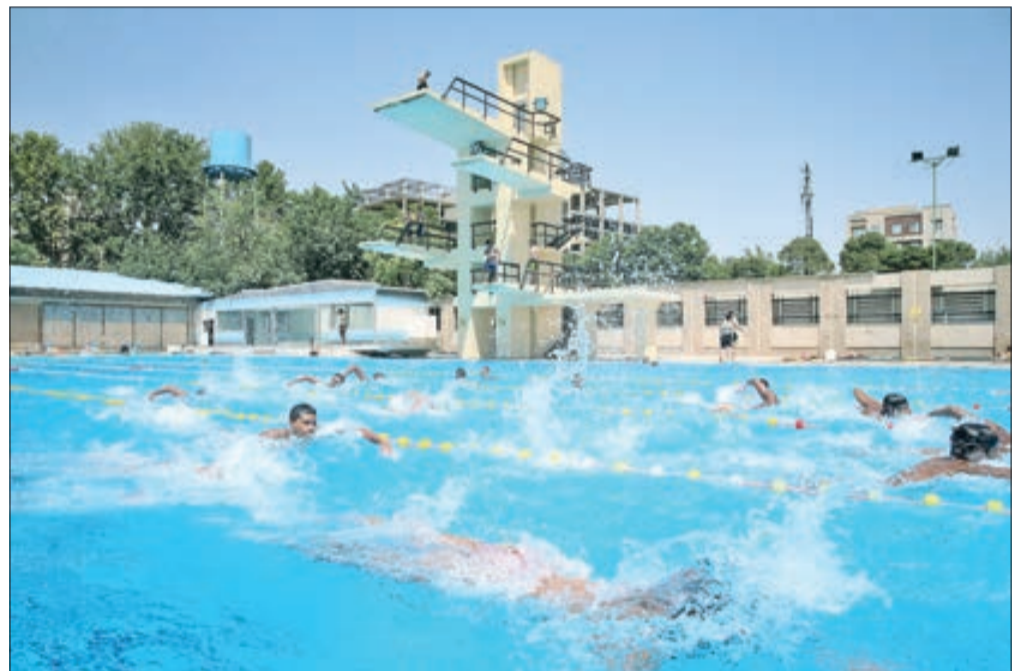
▲ گرمترین روزها