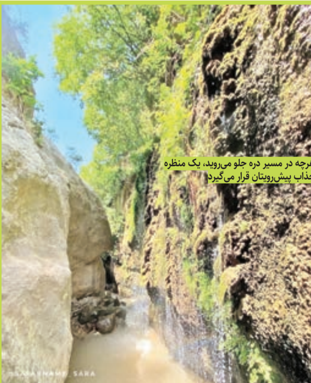
هرچه در مسیر دره جلو می‌روید، یک منظره جذاب پیش‌رویتان قرار می‌گیرد