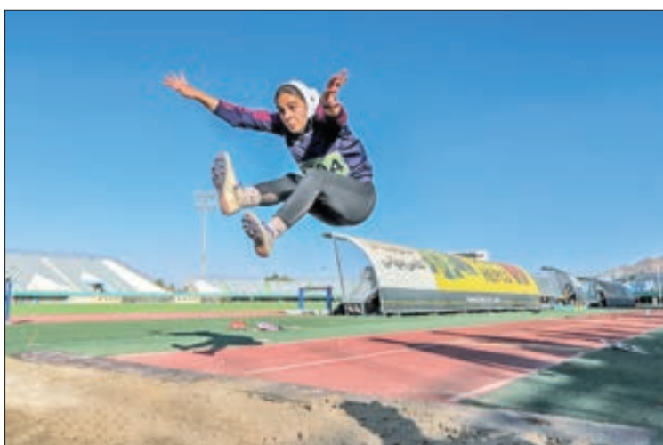
▲ مسابقات دو و میدانی نونهالان