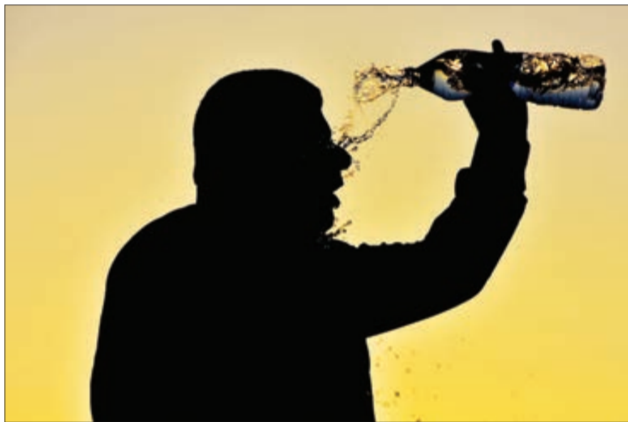
▲ این روزها در آبادان