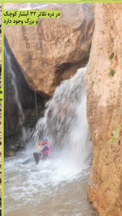
در دره تلاتر ۳۲ آبشار کوچک و بزرگ وجود دارد