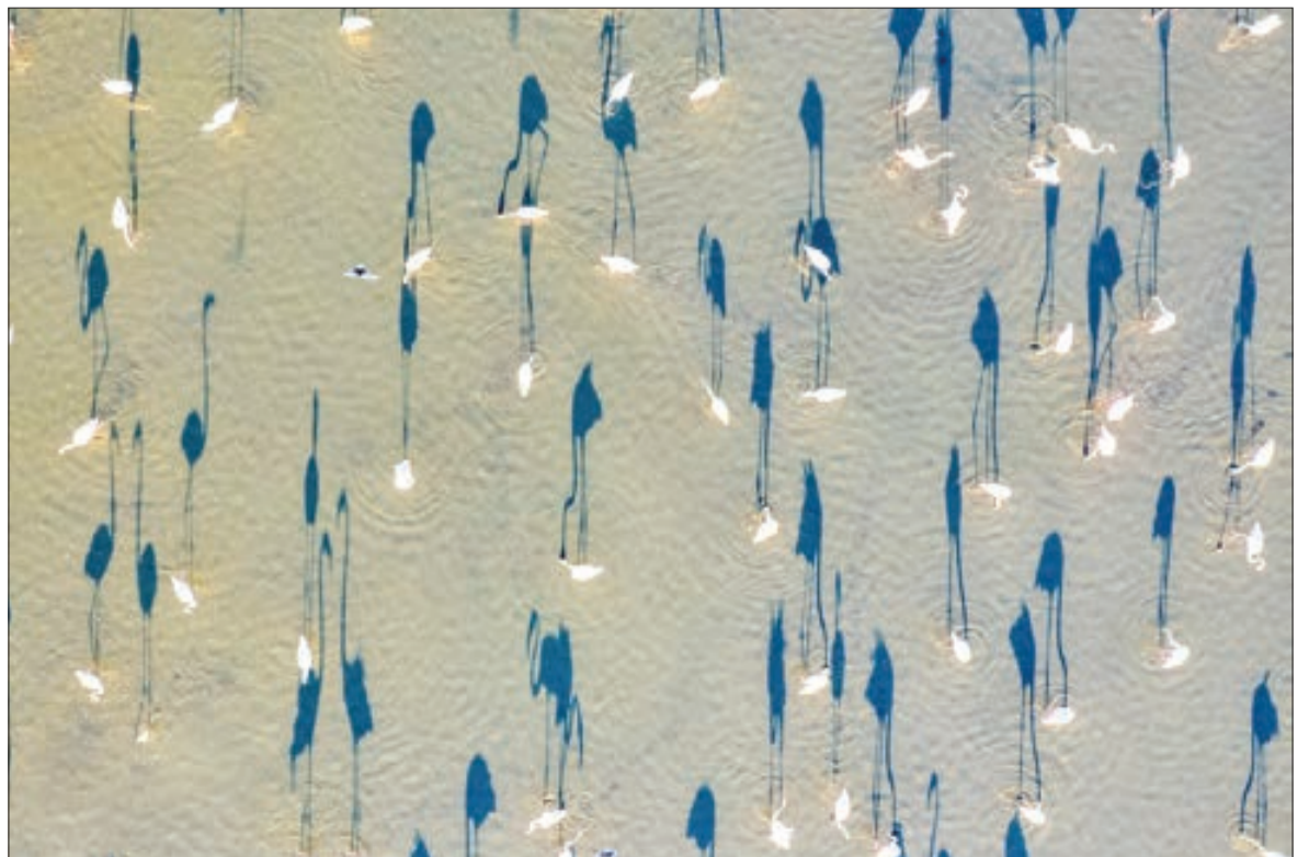
▲ تالاب سئیران گولی میزبان ۱۰ هزار فلامینگو