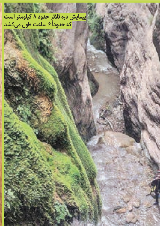
پیمایش دره تلاتر حدود ۸ کیلومتر است که حدوداً ۶ ساعت طول می‌کشد