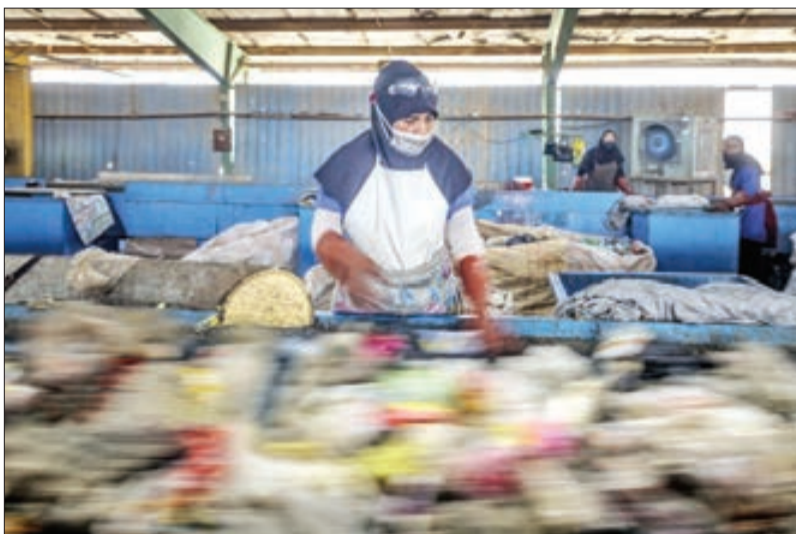
▲ زباله‌دان اهواز