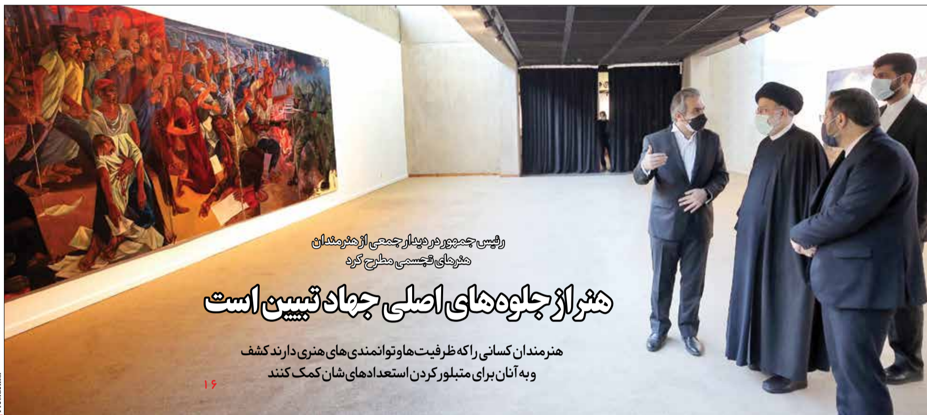
رئیس‌جمهور در دیدار جمعی از هنرمندان هنرمندانی تجسمی مطرح کرد