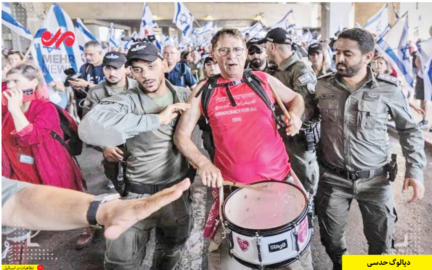
تظاهرات در اسرائیل

پرچمتو وقتی می‌سوزه عشقه! هر کی واست کیسه می‌دوزه عشقه!