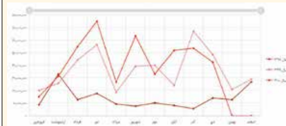
واردات عمان به ایران از سال ۹۸ تاکنون

شناخت زیادی از کالاهای ایرانی ندارند. بر اساس آمارهای موجود، آهن و فولاد، سوخت‌های فسیلی و زغال سنگ، محصولات روغنی، حیوانات زنده، غلات، انواع سبزیجات خوراکی و سیب زمینی، میوه و مرکبات، آجیل، خربزه و هندوانه، انواع نمک، گوگرد، خاک، سنگ آهک، گچ، سیمان، توتون و تنباکو، محصولات دریایی ماهی، صدف و سایر آبزیان در محصولات سرامیکی از دیگر حوزه‌هایی است که تاجران ایرانی می‌توانند صادرات خوبی به کشور عمان داشته باشند.