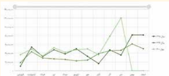
صادرات ایران به عمان از سال ۹۸ تاکنون