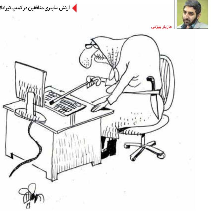
ارتش سایبری منافقین در کمپ تیرانا!