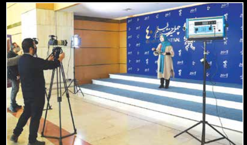
خبرنگاران در حال پوشش چهلین جشنواره فیلم فجر