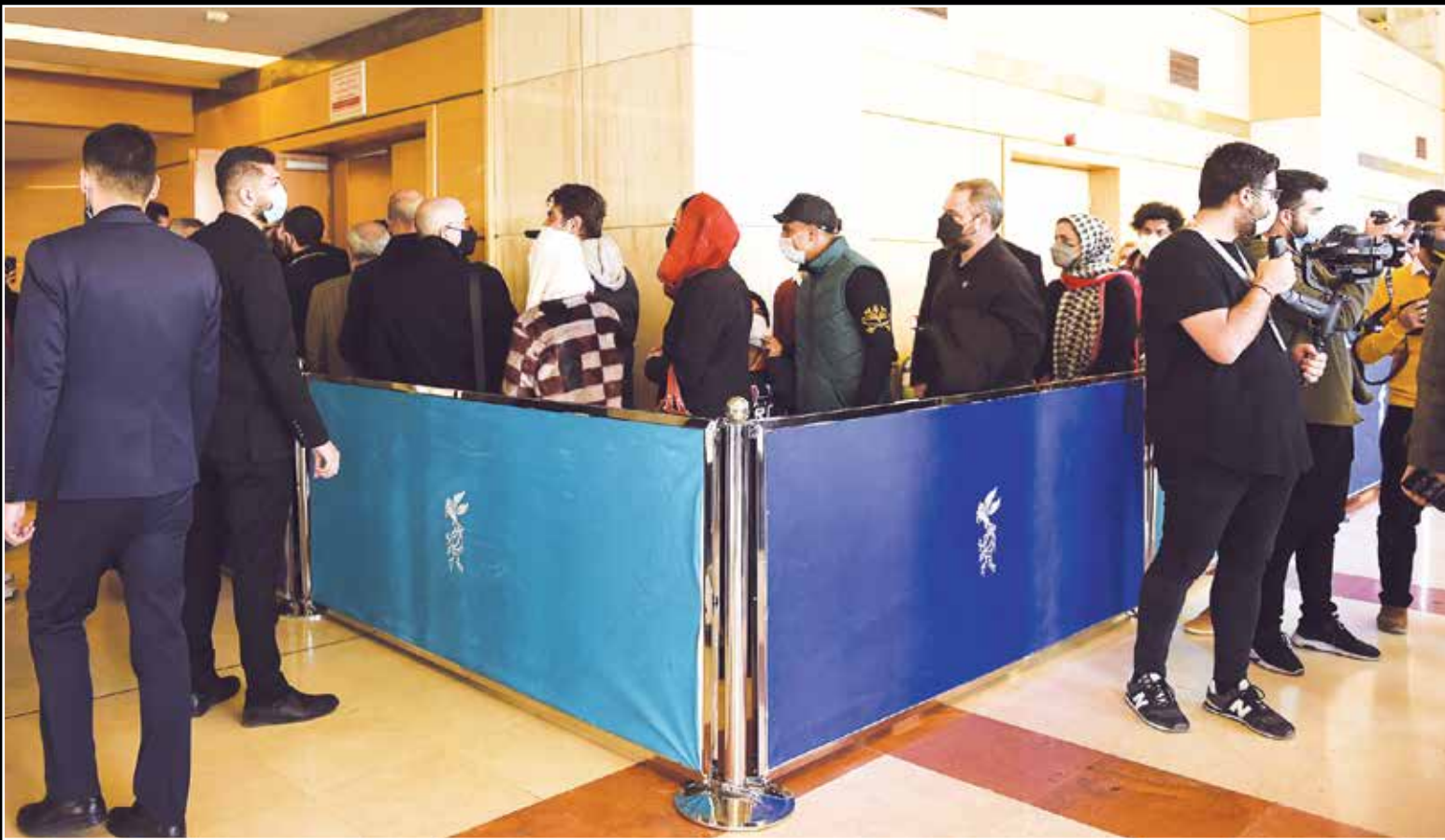
صف ورود به سالن سینما در اولین اکران جشنواره فیلم فجر