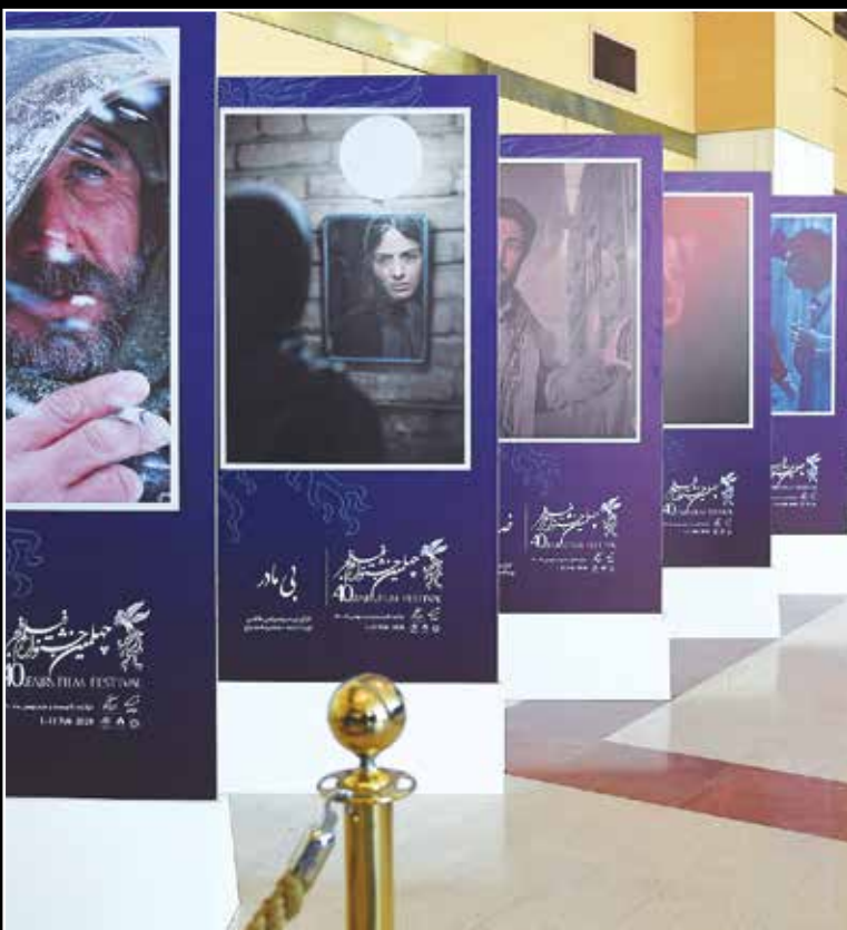
نمایشگاه عکس فیلم‌های چهلین جشنواره فیلم فجر