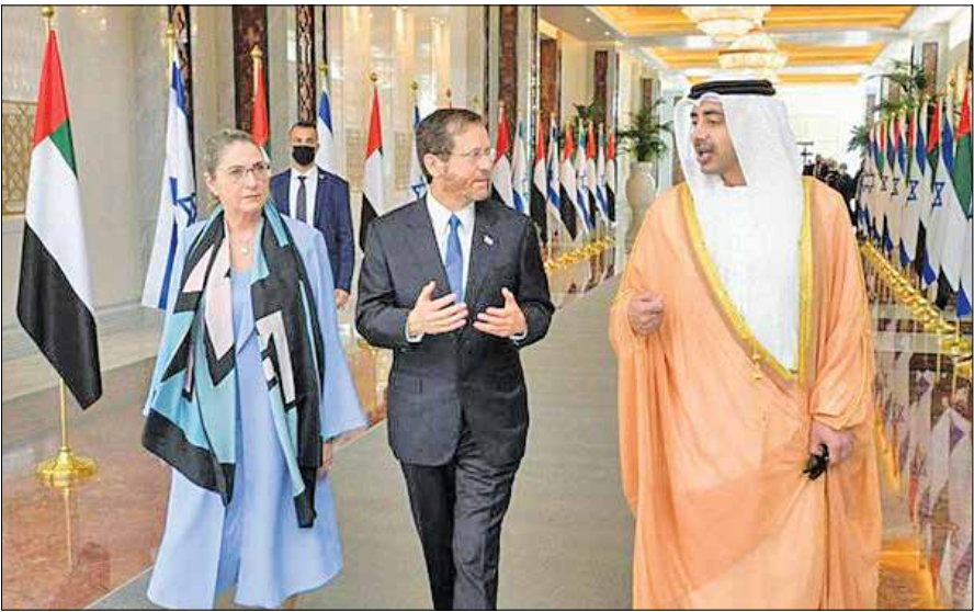
دیدار رئیس رژیم صهیونیستی با امیر امارات

باشد. اما زنگ خطر پیگیری این رویکرد از سوی اعراب در منطقه زمانی به صدا درآمد که «پایدن» به رغم سلفش چندان تمایلی به ادامه حمایت همه جانبه از متحدان عیش از خود نشان نداد و با کلید زدن راهبرد خروج تدریجی از خاورمیانه و تمرکز بر آسیا و مقابله با چین به عنوان یک قدرت عظیم اقتصادی نشان داد که دغدغه‌ای فراتر از نگرانی‌های امنیتی شرکای عریش دارد. با این حال ناگفته نماند که «اسرائیل» به عنوان یک متحد استراتژیک برای دولت‌مردان امریکایی یک استثنا باشد و عادی‌سازی روابطش با اعراب می‌توانست خیال واشنگتن را از تأمین منافع این رژیم در منطقه آسوده سازد. این در حالی بود که بعد از قرار گرفتن مذاکرات احیای برجام در مسیر پیشرفت و سازی که اسرائیل علیه این روند موفقیت آمیز کوک کرد، این واقعیت پدیدار شد که مقام‌های