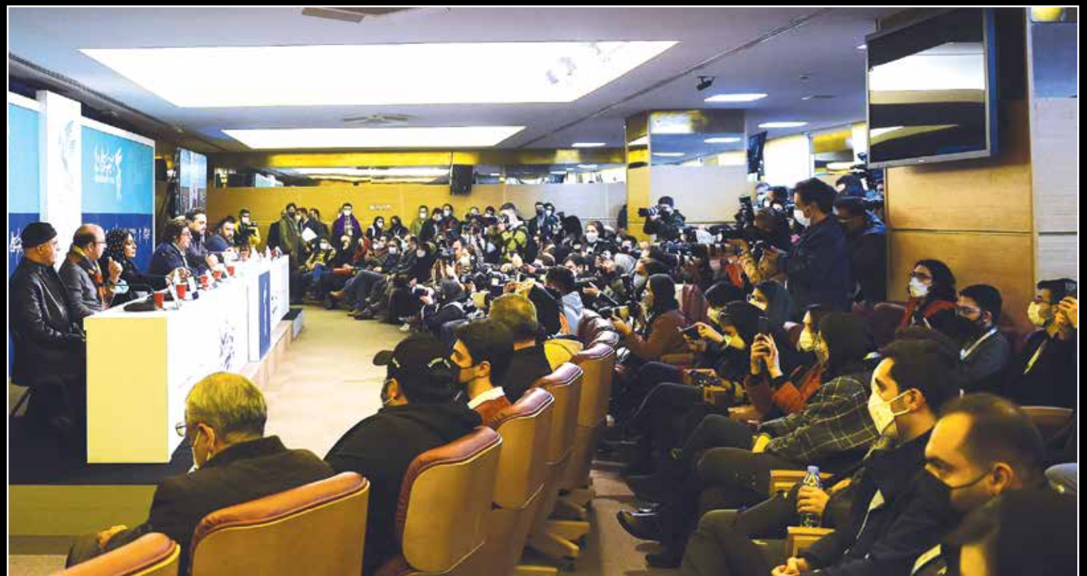
عوامل فیلم «بیرو» در اولین نشست خبری چهلین جشنواره فیلم فجر