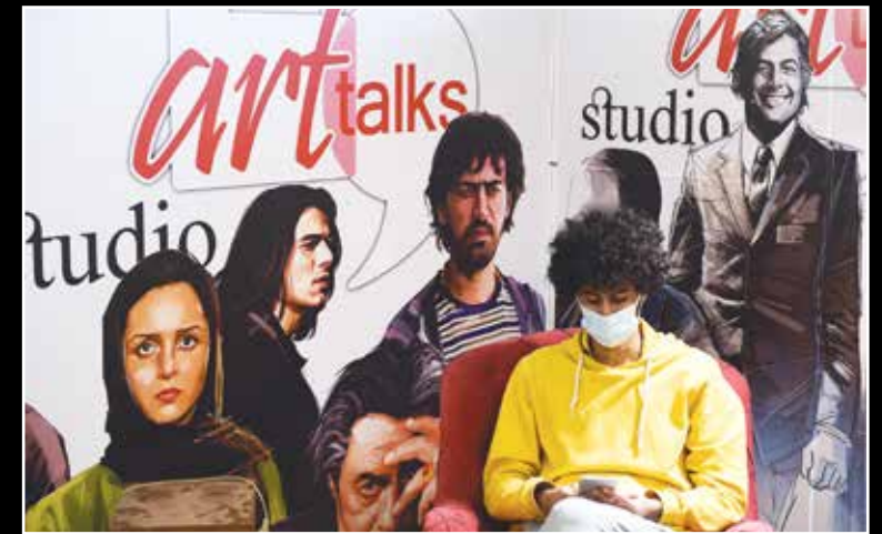
حاشیه اولین روز چهلین جشنواره فیلم فجر در برج میلاد