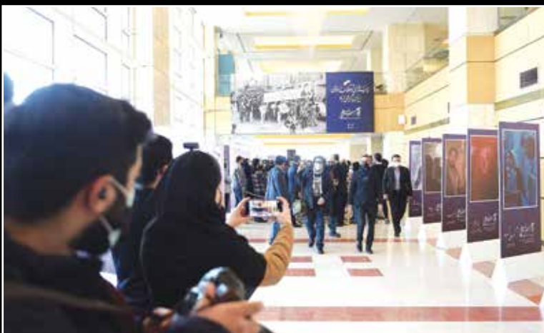
در حاشیه پخش فیلم‌های فجر در خانه جشنواره