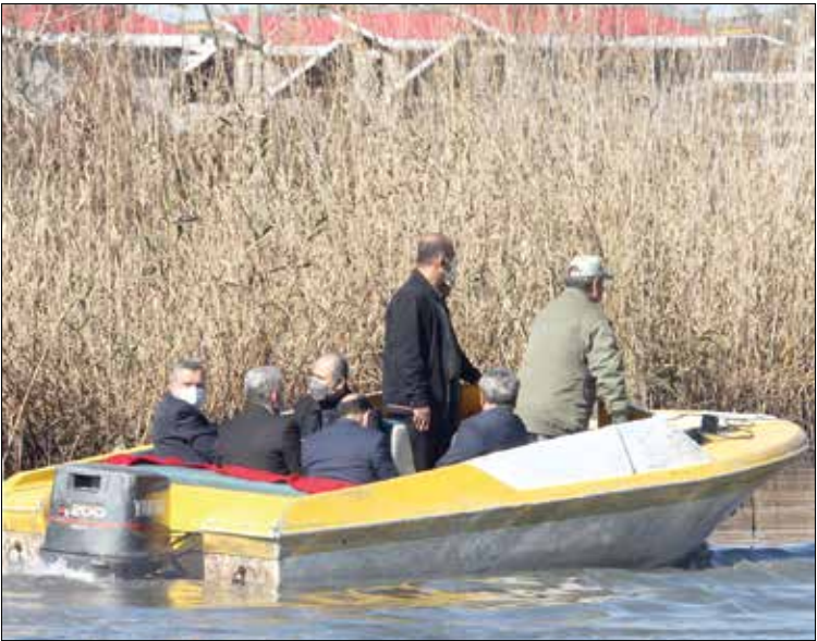
بازدید معاون اجرایی رئیس‌جمهور از اجرای طرح آزادسازی سواحل انزلی

به این ترتیب می‌توان گفت اراده برای آزادسازی سواحل از متصرفات دولتی، حاکمیتی و بخش خصوصی، اضلاع مختلفی داشته است؛ اضلاع مورد اشاره، مثلی از هماهنگی میان اجزای مختلف نظام را شکل می‌دهند که می‌تواند به عنوان الگو در حل سایر مسائل کشور نیز تکرار شده و به کار گرفته شود. این امر از آن رو مهم است که شاید آزادسازی سواحل جزو اولویات‌های اساسی مردم نبوده است، اما نشان داد که در صورت وجود اراده و هماهنگی میان بخش‌های مختلف حاکمیت و نظام، هم مسائل قابل شناسایی است و هم قابل حل.