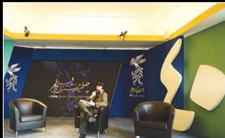
غرفه‌های آماده شده برای نشست‌های چینی هنرمندان