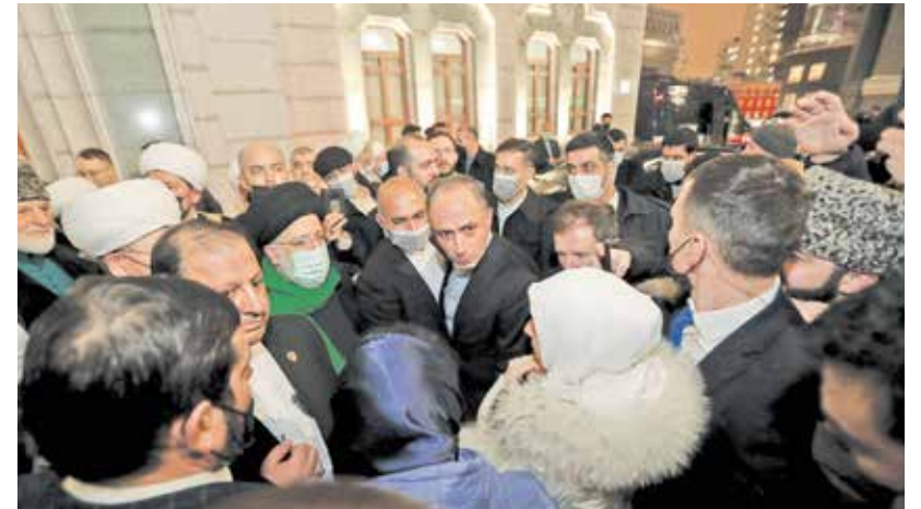
آیت‌الله‌ریسی در جمع نمازگزاران مسجد جامع مسکو