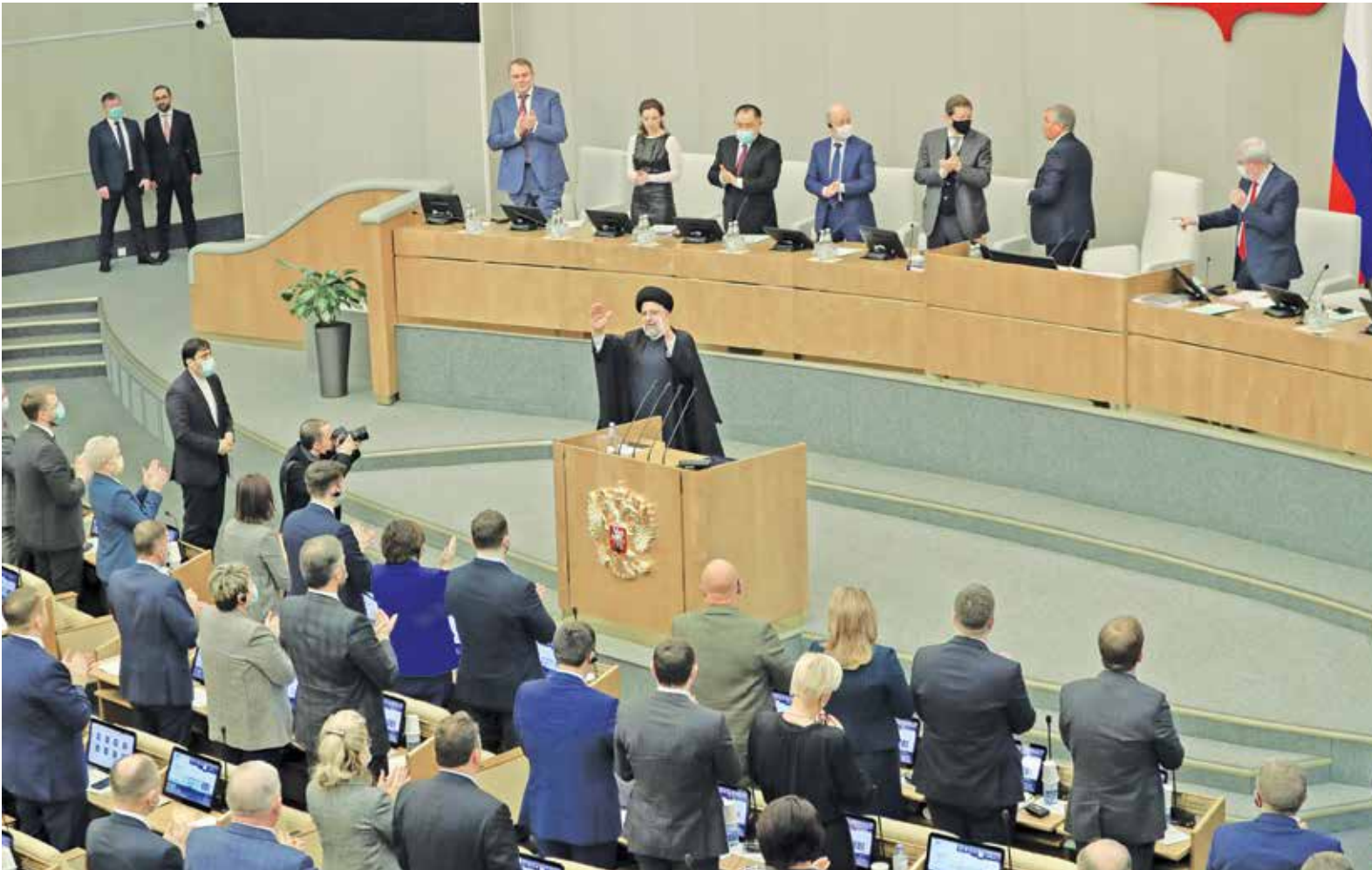
سخنرانی در دوما روسیه، پایگاه اطلاع رسانی ریاست جمهوری

رئیس‌جمهور در بازگشت از سفر دوازده روزه خود به روسیه که به دعوت ولادیمیر پوتین صورت گرفت، در فرودگاه مهرآباد درباره دستاوردهای این سفر گفت: «در حوزه مسائل تجاری بر رفع موانع و جهش تجارت بین دو کشور توافق شد. در حال حاضر سطح تعاملات تجاری بین دو کشور قابل قبول نیست، لذا دو کشور توافق کردند در گام اول تعاملات تجاری فیما بین را به ۱۰ میلیارد دلار در سال افزایش دهند.» علاوه بر دیدار سه ساعته با رئیس‌جمهور روسیه در روز نخست، سخنرانی در مجلس دوما روسیه، نشست با جمعی از فعالان اقتصادی و تجار روس، نشست با اعضای شورای علمی، استاتید و جمعی از دانشگاهیان دانشگاه ملی مسکو، دیدار با رئیس شورای مسلمانان روسیه، سخنرانی در جمع نمازگزاران مسجد جامع مسکو و دیدار با جمعی از ایرانیان مقیم روسیه، از جمله برنامه‌های روز دوم سفر فشرده آیت‌الله‌ریسی به روسیه بود.