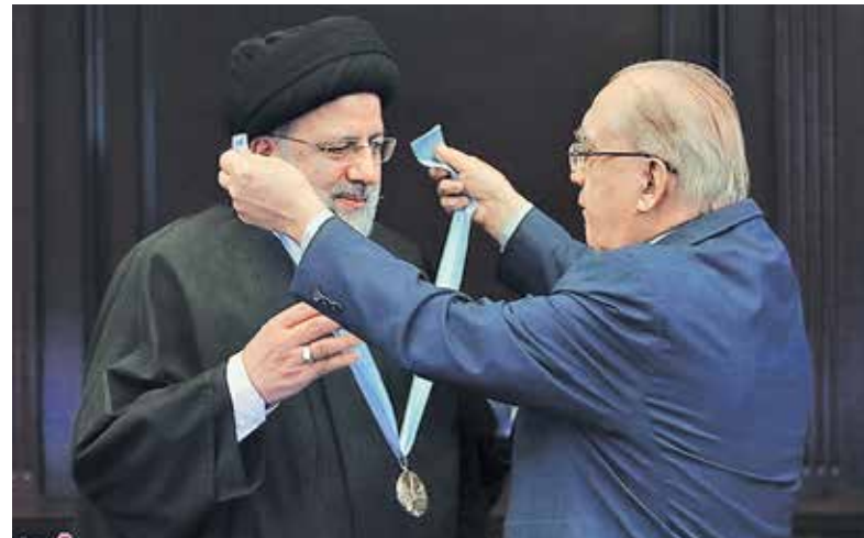
اعطای دکترای افتخاری به آیت‌الله‌ریسی در دانشگاه ملی مسکو / تسنیم