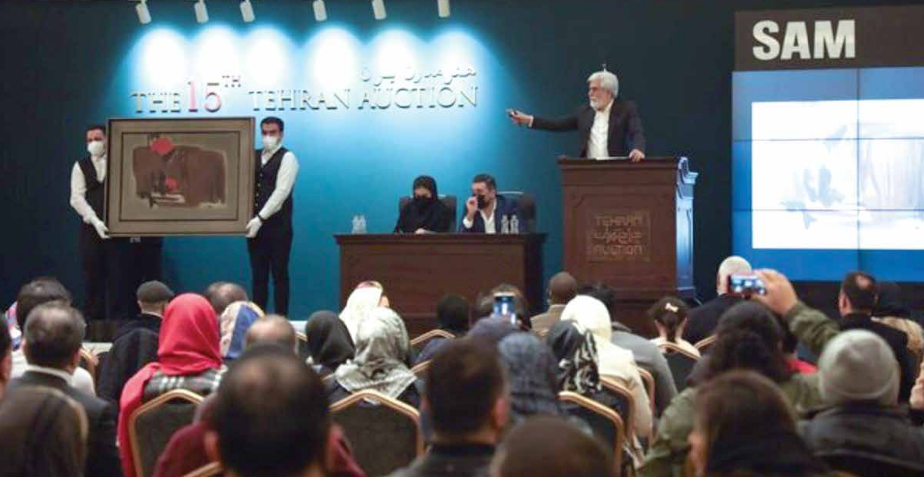
پانزدهمین حراج تهران