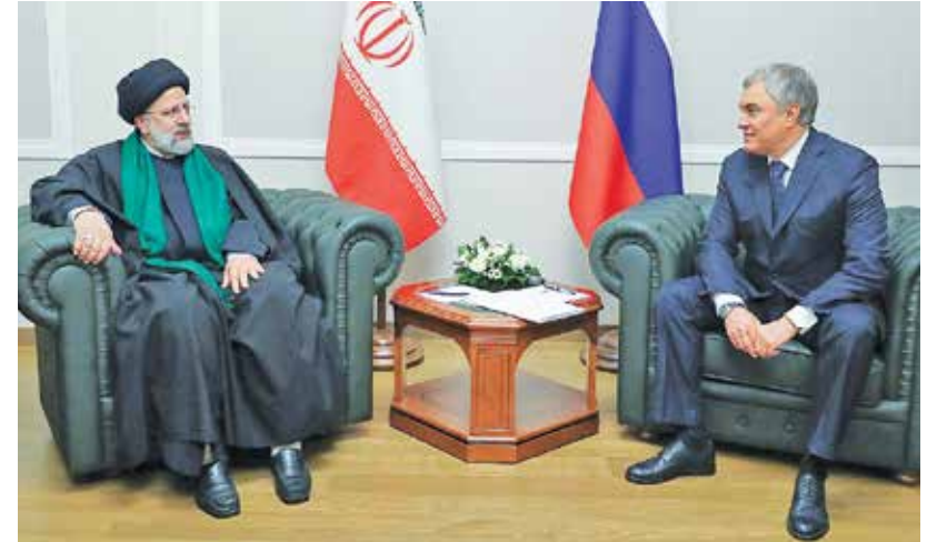
رئیس مجلس دوما روسیه میزبان رئیس جمهور