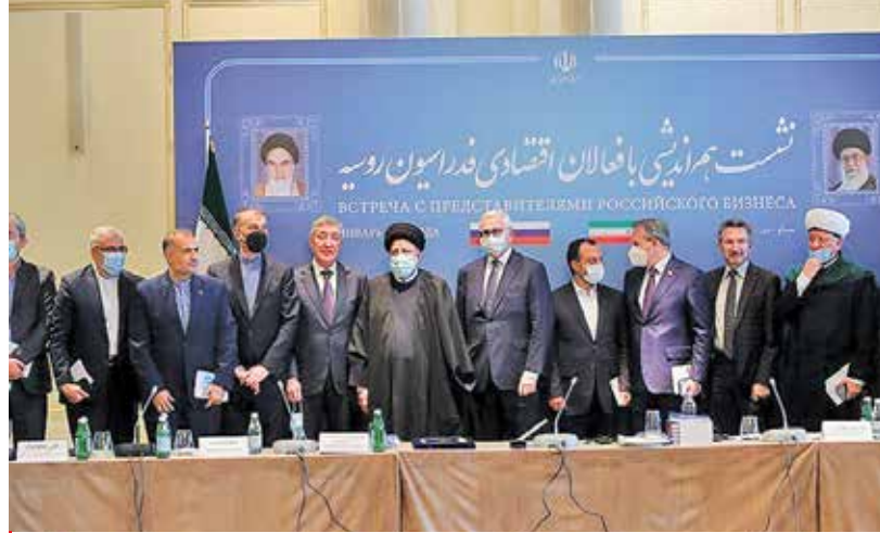
نشست هم‌اندیشی فعالان اقتصادی فدراسیون روسیه با آیت‌الله‌ریسی