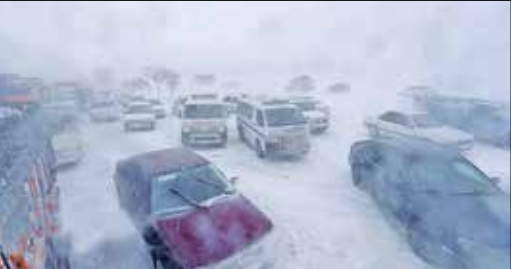
کولک و یخبندان در کرده اسدآباد همدان/ایستا