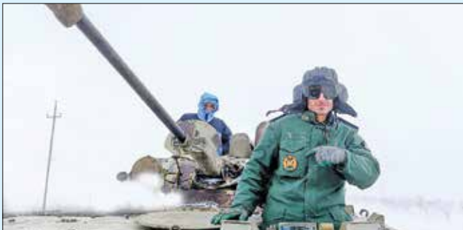
امداد رسانی نیروی زمینی ارتش با نفر بر در کرده اسد آباد همدان/ایستا