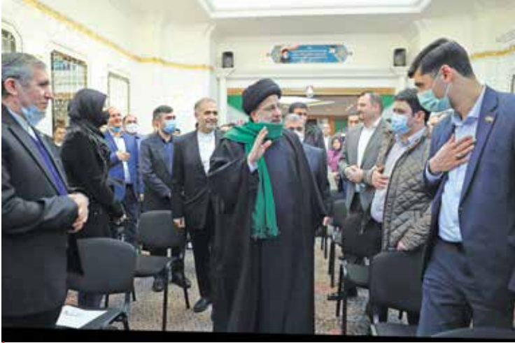
دیدار ایرانیان مقیم روسیه با رئیس جمهور