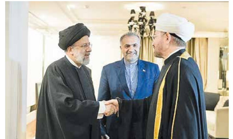
دیدار رئیس جمهور با رئیس اداره دینی مسلمانان و رئیس شورای مفتیان روسیه