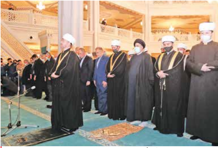
حضور آیت‌الله‌ریسی در جمع نمازگزاران مسجد جامع مسکو