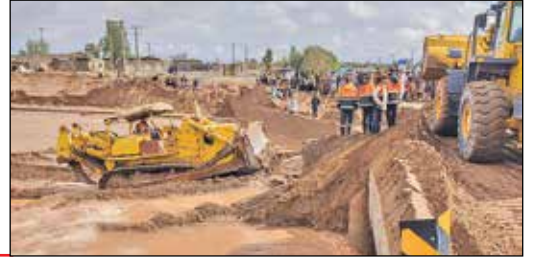
سیل در جنوب کرمان/ایستا

وزیر کشور با اشاره به اینکه تصمیمات خوبی در ستاد مدیریت بحران برای جنوب استان کرمان گرفته شده است، گفت: سیل بند جیرفت باید حدود ۱۵۰ کیلومتر ترمیم و بازسازی شود و منابع مالی برای آن نیز در نظر گرفته شده است. به گزارش ایرنا، احمد وحیدی که تا شامگاه پنجشنبه در کرمان حضور داشت، با اشاره به بازدیدهای میدانی مناطق سیل زده جنوب استان افزود: در نشست با ستاد مدیریت بحران کرمان با همه مسئولان استانی و برخی از مسئولان ملی تصمیم گیری و هر کدام از وظایف و تعهداتی که دستگاه های ملی و استانی پذیرفته بودند در این جلسه مشخص شد. همچنین در حوزه