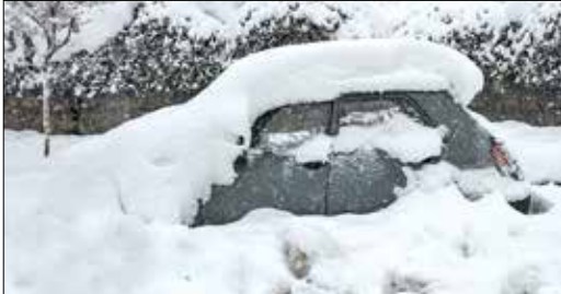
برف سنگین در سنندج