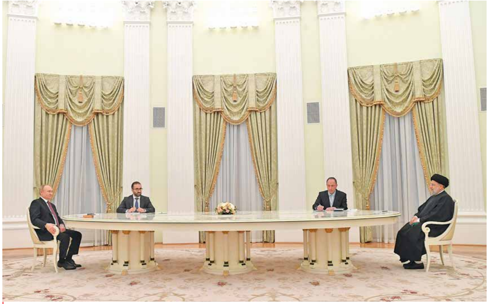
دیدار رؤسای جمهور ایران و روسیه، پایگاه اطلاع رسانی ریاست جمهوری