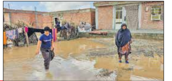
سیل در زهک/ایستا

عکاس - خبرنگار ایرنا در جریان سیل اخیر در شهرستان رودبار جنوب عصر سه شنبه دچار آسیب شد و در معرض سیلاب قرار گرفت به طوری که برخی تجهیزات از جمله لنز دوربین وی را نیز آب با خود برد؛ وی گزارش می دهد که حجم آب آنقدر زیاد بود که در برخی نقاط، اهالی جای مرتفع تری را برای نجات جانشان به سختی پیدا می کردند. بخش عمده مشکل به سیل بندها برمی گردد که بخوبی مرمت یا احداث نشده اند. به گفته وی، با وجود شرایط جغرافیایی منطقه که در معرض جریان آب به سمت تالاب جازموریان قرار