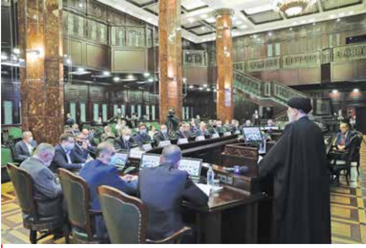
رئیس جمهور در جمع شورای علمی، استاتید و جمعی از دانشجویان دانشگاه ملی مسکو