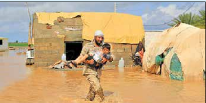
امداد رسانی به سیل زدگان جنوب کرمان توسط نیروهای جهادی