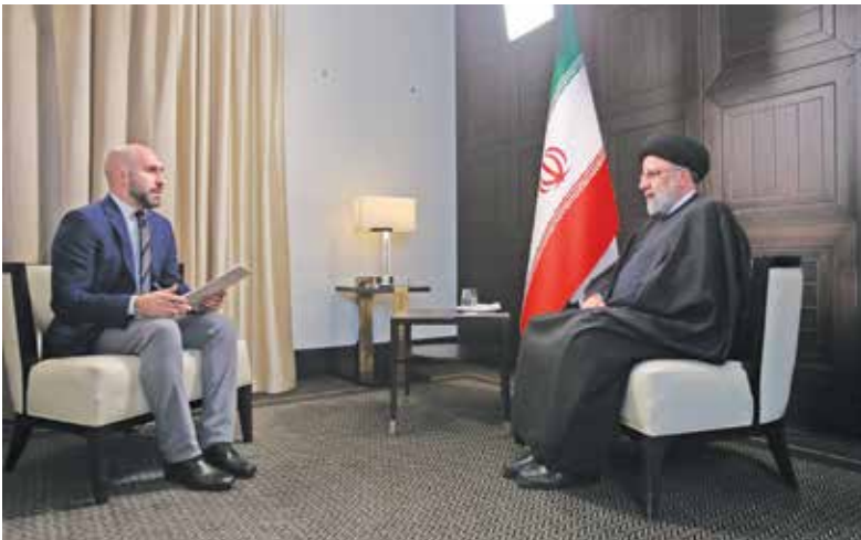
مصاحبه با شبکه ماهواره ای راشاتودی، راشاتودی