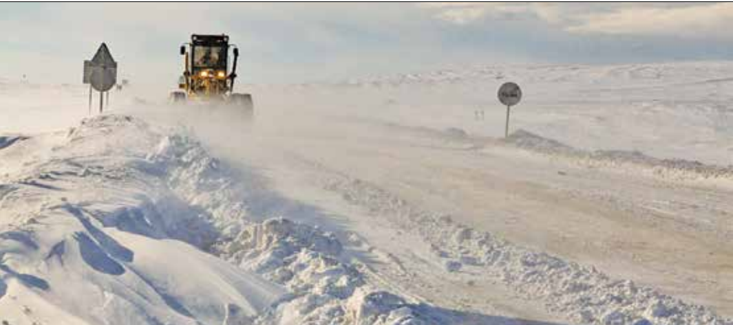
برف رویی در بخش های مرتفع جاده هشتگرد-مران/فراس

تأثیر روز جمعه از یکپار و ۳۶۳ راه روستایی مسدود شده به علت برف ۲۱۰ راه بازگشایی شد و تلاش ها برای بازگشایی دیگر راه های روستایی استان همچنان ادامه دارد. وی همچنین با اشاره به اینکه بارش سنگین برف موجب قطع برق ۶۲ روستا و قطع آب ۴ روستا شده بود تصریح کرد: دیروز صبح برق ۱۵ روستا وصل شد و رفع مشکل برق رسانی به روستاهای دیگر هم ادامه داشت.