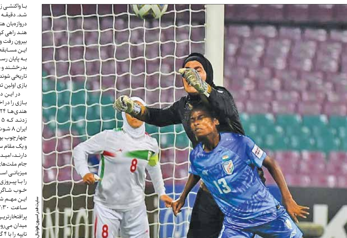
سایت خبر اسپورس فوتبال

کودایی و سیوی مشابه گوردون بنکس دقیقه ۷۶ دیدار هند و ایران، کریس دنگمی بازیکن تعویضی هندی‌ها در فرصت ایده‌آل گلزنی قرار گرفت ولی ضربه سر او در آستانه ورود به دروازه با عکس‌العمل