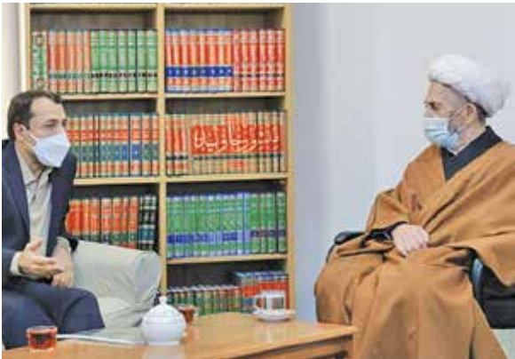
دیدار با آیت‌الله العظمی جعفر سبحانی

وی افزود: همچنین درموضوع تعدد شعب بانکی باید این موضوع بررسی و به منظور تطابق با استانداردهای موجود در این زمینه اقدامات لازم انجام شود. ذکر این نکته ضروری است که در فعالیت‌های بانکی نیز، باید کارمزد واقعی در نظام بانکی مبنای کار باشد. آیت‌الله العظمی سبحانی در پایان افزود: بانک‌ها امانت‌دار مردم باشند. همه باید کمک کنند تا بانکداری اسلامی که به نفع مردم است و از