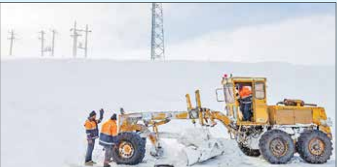
راهداران در آزادراه تهران - زنجان / فراس