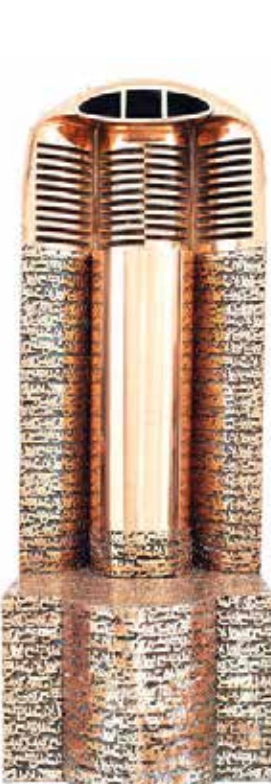
«شاعر نشسته» اثر استاد پرویز تناولی گران ترین اثر حراج پانزدهم