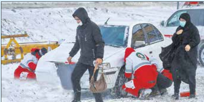
امداد رسانی هلال احمر در کرده اسد آباد/ایستا