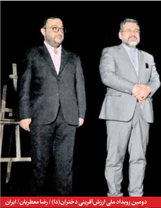
دومین رویداد ملی ارزش آفرینی دختران (۱۵) / رضا معطریان / ایران