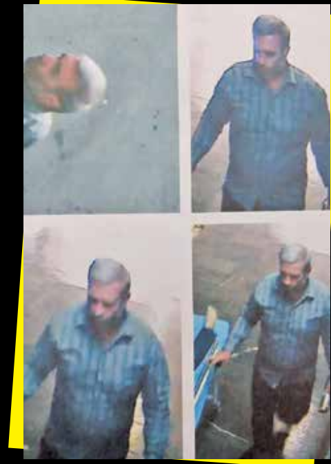
اولین عکس شکار شده از روباه پیر در دوربین‌های مدار بسته بیمارستان فیاض بخش

سرهنگ نثاری اظهار داشت: متهم حتی در اعترافات خود عنوان کرده که تا به حال ازدواج نکرده است اما تحقیقات پلیسی نشان از آن دارد که وی دوبار ازدواج کرده و صاحب ۴ فرزند است. معاون مبارزه با جرایم جنایی