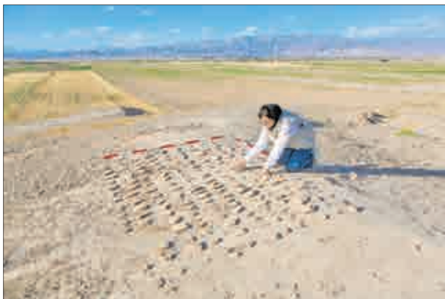
▲ کاوش‌های باستان‌شناسی در یوسف آباد خراسان رضوی