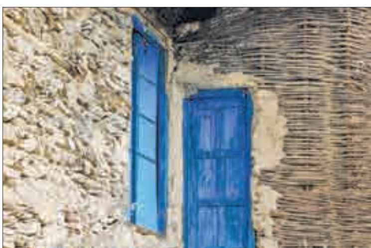
▲ روستای دولاب سنندج