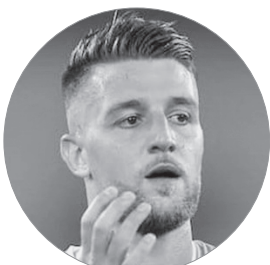
میلینکوویچ؛ ساویچ؛ به الهلال پاسخ مثبت داد