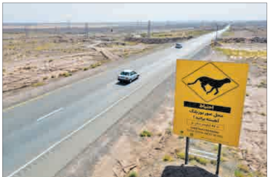
▲ جاده مرگ یوزپلنگ آسیایی