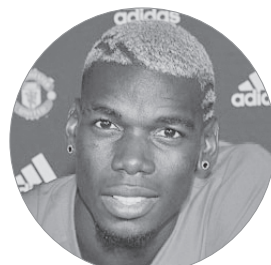
پل پوگبا؛ و پیشنهاد ۱۰۰ میلیونی الاتحاد

ایرنا / کارلو آنچلوتی پس از توافق نهایی با فدراسیون فوتبال برزیل در پایان فصل از تیم رئال‌مادرید جدا می‌شود و برای اولین بار در تاریخ دوران مربیگری خود هدایت یک تیم ملی را بر عهده می‌گیرد. رئال به دنبال گزینه مناسب برای جایگزینی اوست. نشریه انگلیسی دیلی میل مدعی شده که کهکشانی‌ها قصد دارند یکی از چهار بازیکن سابق خود را برای هدایت این تیم انتخاب کنند که زین‌الدین زیدان یکی از آن گزینه‌ها است.