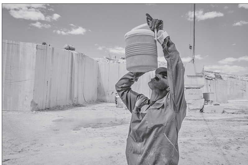
▲ معدن سنگ مرمریت در چناران