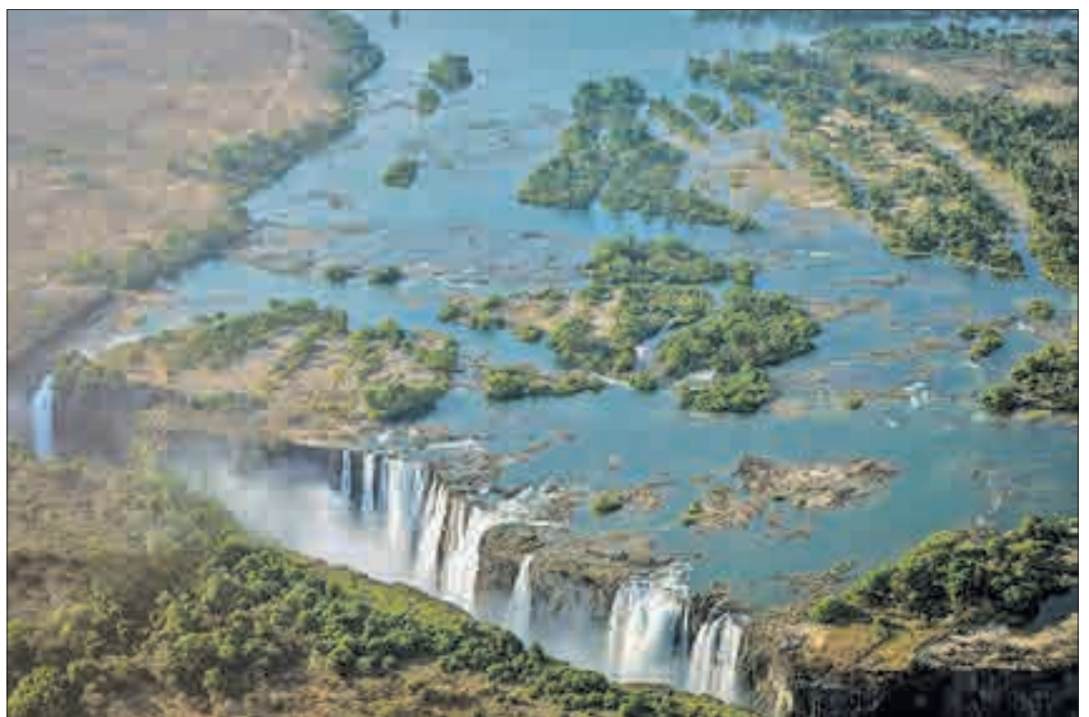
▲ آبشار ویکتوریا در زیمبابوه