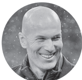
زین‌الدین زیدان؛ گزینه جانشینی کارلو آنچلوتی

تسنیم / باشگاه الهلال در آستانه به خدمت گرفتن سرگی میلینکوویچ ساویچ از لاتزیو است. این در حالی است که باشگاه یوونتوس هم برای به خدمت گرفتن این هافبک صربستانی علاقه‌مند است. بر اساس ادعای روزنامه ایتالیایی «ریپوبلیکا»؛ باشگاه الهلال پیشنهادی ۴۰ میلیون یورویی به لاتزیو ارائه کرده است. طبق این گزارش پیشنهاد باشگاه عربستانی به این هافبک صربستانی سه ساله با دستمزد ۲۰ میلیون یورو در سال است که آن را پذیرفته است.