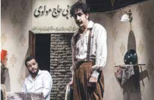
صحنه‌ای از نمایش کبکب به کارگردانی هاشم‌رضا

باشیم که این رونق به‌صورت مداوم ادامه داشته باشد. آنچه مسلم است اینکه طی دو سال گذشته هنرمندان بنام تئاتر آتری را روی صحنه نبرده‌اند، این اتفاق کاملاً دوسویی است؛ اینکه ما می‌توانستیم به کشف استعدادهای جوان و فروخورده‌ای که هیچ وقت سالن به آنها نمی‌رسید بپردازیم، از طرفی همین نبود نظارت بر کیفیت و روی صحنه بردن اثر به هر قیمتی در سال‌های کرونایی باعث شد تا برخی افراد وارد این عرصه شوند که شاید اگر بازار رقابت متعادل بود از لحاظ کیفی حذف می‌شدند. از نظر من ورطه کنونی بسیار حساس است، زیرا ما خودمان باید حواسمان به آثار و مخاطب باشد، از تئاتر دولتی که هیچ وقت آبی گرم نشده و مطمئن باشید شاهکار مدیریت دولتی را در آثار منتخب و چگونگی جشنواره تئاتر فجر خواهیم دید، اما اگر خود اهالی تئاتر به فکر مخاطبان امروز نباشند بار دیگر و بعد از فروکش کردن موج کنونی باید به سختی شاهد پرشدن سالن‌های تئاتر باشیم. البته اگر تئاتر کشور در شرایط خوبی به سر می‌برد امروز پر شدن یک سالن موضوع موفقیت این هنر نمی‌شد، اما با وضع موجود حال که رونقی نسبی به تئاتر بازگشته باید با درایت و برنامه‌ریزی آن را حفظ کنیم.