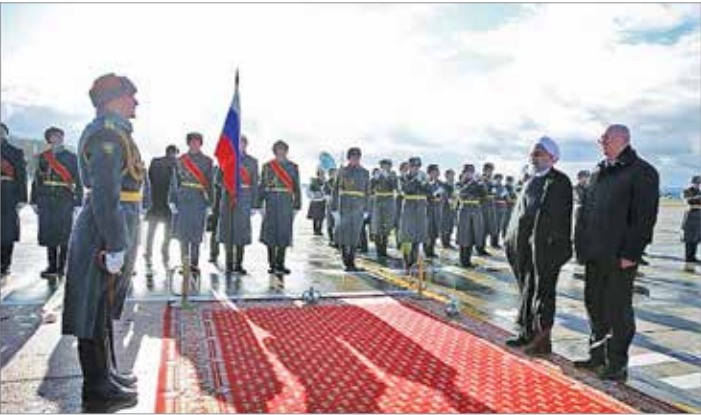
استقبال معاون وزیر خارجه روسیه از روحانی