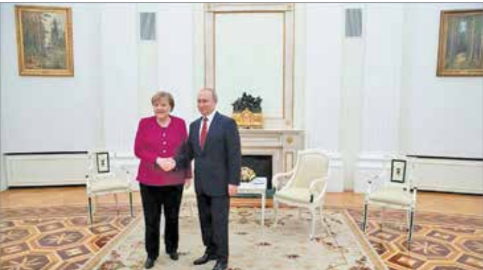
دیدار پوتین و مرکل

پرچم یگان نظامی هر کشوری در گارد تشریفات مورد استفاده قرار می‌گیرد. این مسأله در مراسم استقبال از مقامات سایر کشورها در ایران نیز شاهد و مثال‌های فراوانی دارد.