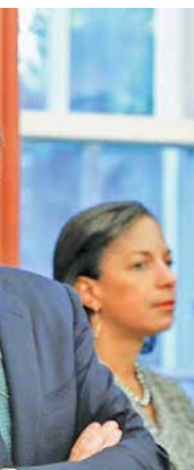
جو بایدن، آنتونی بلینکن و سوزان رایس؛ رئیس‌جمهور، وزیر امور خارجه و رئیس شورای سیاست داخلی کاخ سفید

اشاره مقام‌های امریکایی به موضوع «تضمین» که بیشتر تلاشی برای رفع مسئولیت حقوقی دولت