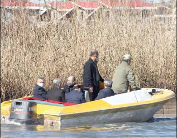
بازدید معاون اجرایی رئیس‌جمهور از اجرای طرح آزادسازی سواحل انزلی

به این ترتیب می‌توان گفت اراده برای آزادسازی سواحل از متصرفات دولتی، حاکمیتی و بخش خصوصی، اضلاع مختلفی داشته است؛ اضلاع مورد اشاره، مثلی از هماهنگی میان اجزای مختلف نظام را شکل می‌دهند که می‌تواند به عنوان الگو در حل سایر مسائل کشور نیز تکرار شده و به کار گرفته شود. این امر از آن رو مهم است که شاید آزادسازی سواحل جزو اولویت‌های اساسی مردم نبوده است، اما نشان داد که در صورت وجود اراده و هماهنگی میان بخش‌های مختلف حاکمیت و نظام، هم مسائل قابل شناسایی است و هم قابل حل.