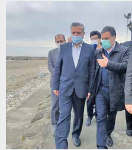
حضور معاون اجرایی رئیس جمهور در مازندران