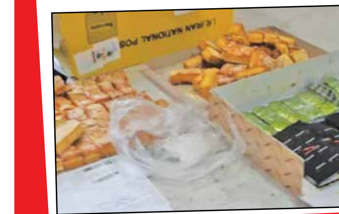
تصویر از شیرینی است

۲ و یکپلو و ۴۶۹ گرم که در قالب بسته‌های پستی قرار بود به مقاصد هندوستان و بنگلادش ارسال شوند، توسط کارکنان امانات پستی فرودگاه امام خمینی (ره) کشف و ضبط و برای انجام مراحل قضایی تحویل مقامات ذیصلاح شد. وی افزود: از مرسوله پستی «شیرینی زبان» به مقصد «کلن» آلمان هم ۳۷۰ قرص مخدر متادون ۴۰، ۱۹۸ قرص B۲ و ۳۲ قرص جنسی به وزن ۲۹۹ گرم توسط کارکنان گمرک کشف شد. محموله یک‌هزار و ۴۶۰ آمپول «هپارین سدیم» هم در حین کنترل گنلادش توسط کارکنان گمرک «دوغارون» استان خراسان رضوی در مرز ایران و افغانستان از چمدان لباس مستعمل و وسایل همراه دو تبعه افغانستانی که به طرز ماهرانه‌ای جاساز شده بود کشف و ضبط شد.