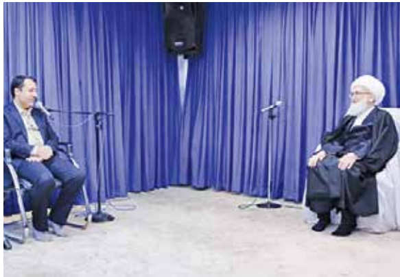
دیدار با آیت‌الله العظمی نوری همدانی

وی خاطر نشان کرد: امیدوارم به یاری خداوند بتوانیم شرایطی را فراهم کنیم که دغدغه مراجع و متدینین درخصوص امور بانکداری رفع شود. همچنین در این دیدارها علی صالح‌آبادی گزارشی از اقدامات بانک مرکزی ویژه در راستای تحقق بانکداری اسلامی و تقویت ارزش پول ملی را به مراجع تقلید و آیات عظام ارائه کرد.