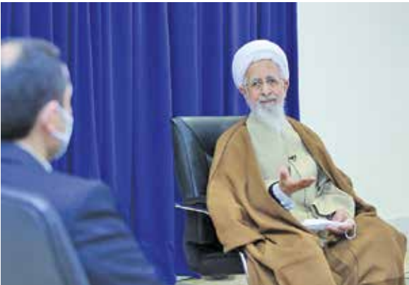
دیدار با آیت‌الله العظمی جوادی آملی

صالح‌آبادی یادآور شد: در همین راستا فهرست افرادی که توسط شورای فقهی احراز صلاحیت شوند در اختیار بانک‌ها قرار خواهد گرفت.