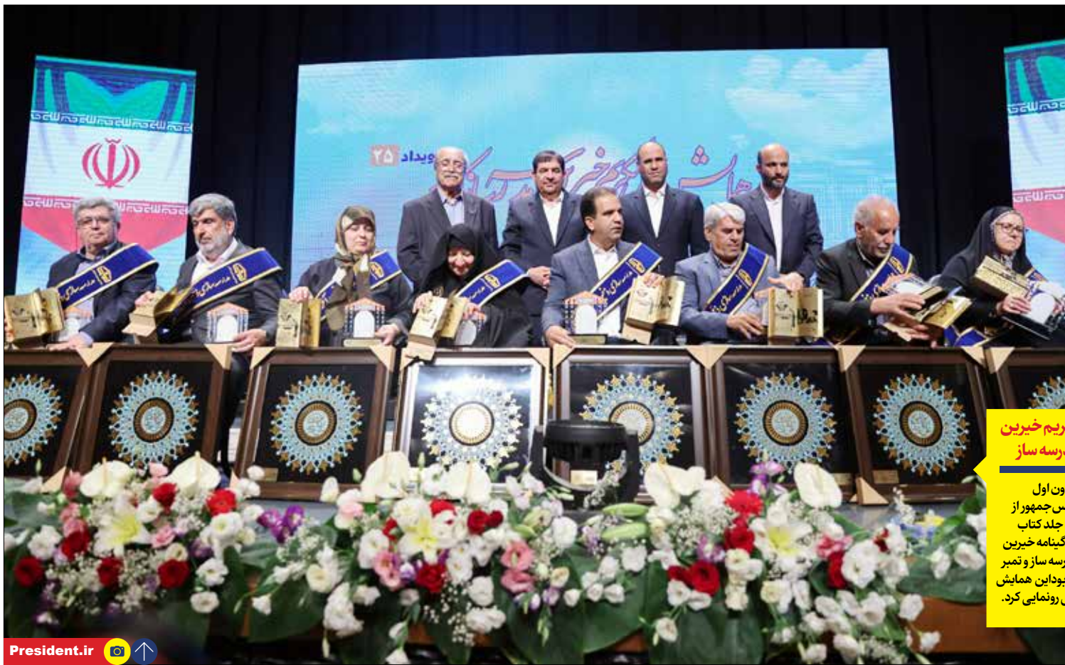
تکریم خیرین مدرسه ساز

معاون حقوقی رئیس‌جمهور: دیوان صلاحیت ورود ندارد + حکم دیوان با قانون اساسی مغایرت دارد