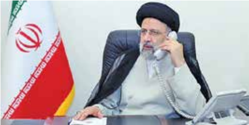
ایران در ایران