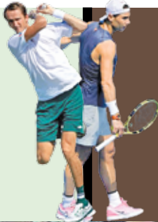
مدودف - نادال، فینال تنیس گرند اسلم استرالیا را برگزار می کنند