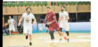
زور هندبالیست‌ها به تیم چندملیتی قطر نرسید

گروه ورزشی/ تیم ملی هندبال ایران با قبول شکست مقابل قطر از صعود به فینال رقابت‌های قهرمانی آسیا بازماند. شاگردان فرناندز برای رسیدن به مرحله نیمه نهایی ۵-۶ برد پیاپی مقابل کویت، عراق، هند، استرالیا و عربستان و یک شکست مقابل بحرین کسب کردند تا اینکه دیروز دیدار نیمه نهایی را در سالن گرین هال شهر دمام عربستان مقابل قطر برگزار کردند. قطرها در حالی به مصاف ایران رفتند که دو بازیکن کوبایی، ۳ تونسسی، ۲ بوسنیایی و یک مصری را در ترکیب داشتند. این تیم ۱۶ بار در رقابت‌های قهرمانی مردان آسیا شرکت داشته که در ۴ دوره اخیر مقام اول را از آن خود کرده است. آنها همچنین ۹ بار در جهان به میدان رفته‌اند که بهترین نتیجه به سال ۲۰۱۵