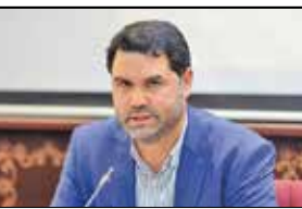
مسال روحانی روزنامه‌نگار

هر کسی که علاقه داشت پیاده تا ورودی برود یا هر کسی خواست با اتوبوس تردد کند که بیشتر هم انتخاب‌شان اتوبوس بود. بخش قابل توجهی از کسانی که به ورزشگاه حضور داشتند را در تصاویر رسانه‌ها مشاهده کردیم. ما وقتی اتهام «گزنیتی» بودن را شنیدیم، به مزاح اگرچه تم گزنیتی! سایت فروش بلیت آنجا با نوج به تاریکی وجود ندارد. ۲ اگرچه با اختلاف مواجه بوده اما باز شده و متناسب با ظرفیت در نظر گرفته شده در سایت که عدد مشخصی بود، افراد ثبت نام کردند.»