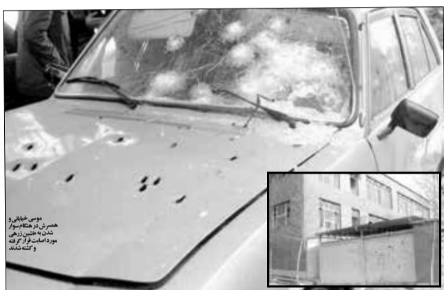
روزنامه به مناسبت چهلمین سالگرد نفوذی سادده‌خانی منافقین

جزئیات به هلاکت رسیدن موسی خیابانی، همسر رجوی و ده عضو مرکزیت منافقین