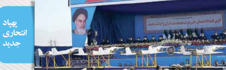
پهپاد انتحاری جدید

مراسم رژه ۲۹ فروردین سالروز ارتش جمهوری اسلامی ایران و گرامیداشت قهرمانی‌های نیروی زمینی میبج دیروز با حضور آیت‌الله‌سید ابراهیم رئیسی رئیس‌جمهور در جوار مرقد مطهر