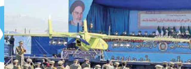
پهپاد ابابیل ۵ مجهز به ۶ مدمب قائم