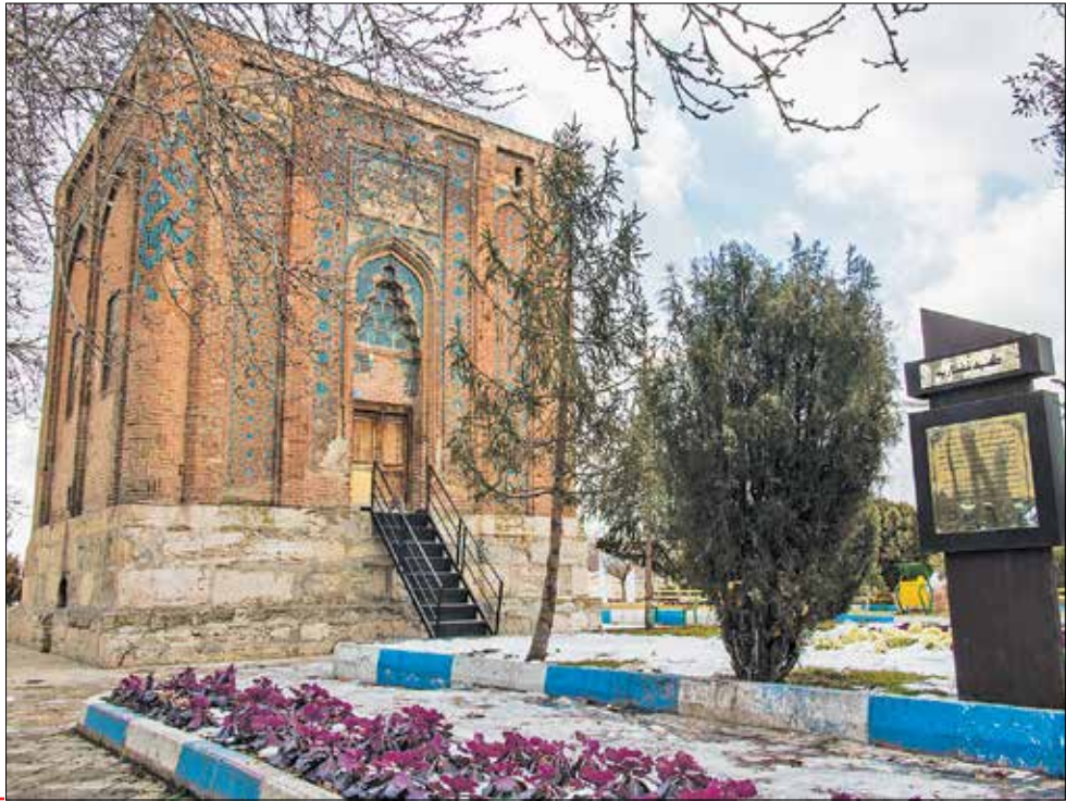
برج غفاریه در ساحل صوفی رود