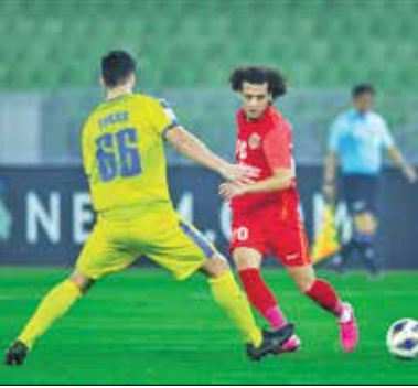
لیگ قهرمانان آسیا