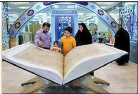
عنته مقدسه حسینه در این نمایشگاه حضور دارد که قرار است بحث‌های مربوط به شهدای مدافع حرم در این بخش مطرح شود.