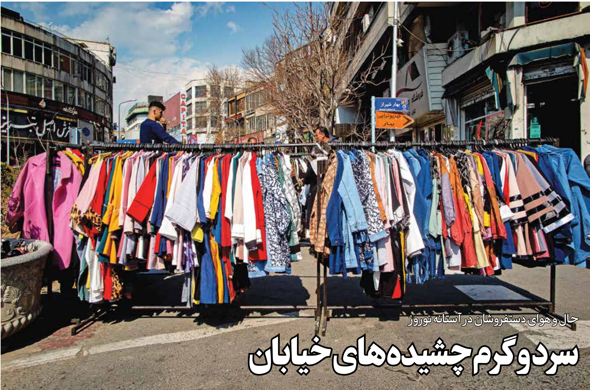
حال و هوای دستفروشان در آستانه نوروز

با رویش گل های بهار، خمینی شهری ها با برگزاری پنجمین جشنواره گل شببو و گل های بهار در استان اصفهان به استقبال نوروز رفتند.