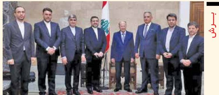
دیدار وزیر فرهنگ و ارشاد اسلامی و هیات همراه با میشل عون رئیس جمهور لبنان

وزیر فرهنگ و ارشاد اسلامی در جریان سفر به لبنان با میشل عون رئیس جمهور لبنان، نبیه بری رئیس مجلس و نجیب میقاتی نخست وزیر این کشور دیدار کرد. اسماعیلی در این دیدارها با اشاره به سابقه دیرینه فرهنگی دو کشور گفت: دولت مردمی برنامه های وسیعی برای گسترش تعاملات فرهنگی در منطقه دارد و لبنان به سبب دوستی و سابقه طولانی فرهنگی و تمدنی با ایران، اولین مقصد دیپلماسی فرهنگی در این دوره از وزارت فرهنگ و ارشاد اسلامی است، تأکید کرد که چهره های مطرح علمی دو کشور تأثیرات بسیاری بر مردم ایران و لبنان داشته اند. علما، فضلا و دانشمندان ایرانی و لبنانی سبب ساز اشتراکات فرهنگی شده اند. وزیر فرهنگ و ارشاد اسلامی با اشاره به برگزاری هفته فرهنگی ایران در لبنان گفت: این رویداد مهم می تواند فصل نویینی از مناسبات فرهنگی دو کشور را رقم بزند و تلاش های وزیر فرهنگ لبنان برای برگزاری این هفته شایسته تقدیر است و امیدواریم رویداد مشابه در ایران با حضور هنرمندان لبنانی رخ دهد. وزیر فرهنگ در کاخ عبیدا هم با میشل عون رئیس جمهور لبنان درباره مناسبات دو جانبه و اهمیت توسعه تبادلات فرهنگی رایزنی کرد. عون در این دیدار فرهنگ غنی ایران و سابقه دیرین روابط دو ملت را مهمترین پشتوانه برای تعمیق روابط فرهنگی دانست. وزیر فرهنگ و ارشاد اسلامی کشورمان در دیدار ظهر