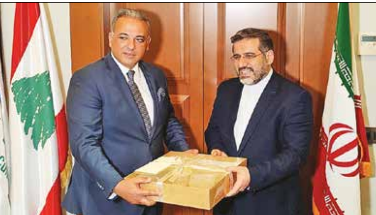
دیدار وزیر فرهنگ و ارشاد اسلامی با محمد وسام المرعزی وزیر فرهنگ لبنان

وزیر فرهنگ و ارشاد اسلامی در دیدار با میشل عون رئیس جمهور لبنان: