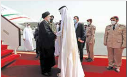
استقبال امیر قطر از آیت‌الله رئیسی پای پلکان هوایما

گروه سیاسی / امضای ۱۴ سند همکاری، یکی از دستاوردهای نخستین روز سفر رئیس‌جمهور به قطر بود؛ سفری که می‌توان آن را فراتر از چهارچوب دوجانبه ارزیابی کرد و نشانه‌های متعددی برای آن ارائه نمود. هم‌محورهای مذاکرات سران دو کشور و هم‌اظهارات و اشارات آیت‌الله رئیسی نشان می‌دهد که جمهوری اسلامی ایران، اهداف بلندتری در منطقه، بویژه در رابطه با کشورهای خلیج فارس مدنظر دارد و در این راستا، سفر به قطر و تقاهم‌های گسترده با این کشور را می‌توان نقطه آغازی برای اهداف بلندمدت و با گستره جغرافیایی بیشتر، قلمداد کرد. به بویژه