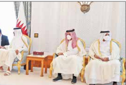
گفت‌وگو، سران پس از استقبال رسمی