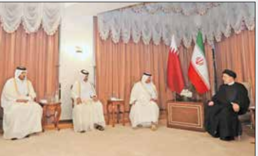
دیدار با نخست‌وزیر قطر