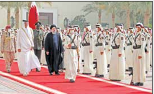
استقبال رسمی در دیوان امیری

اینکه مطابق تأکید رئیس‌جمهور در این سفر، با توجه به خروج نیروهای خارجی، اکنون منطقه وارد مرحله جدیدی شده است. از سوی دیگر، دیدارهای متنوعی که آیت‌الله رئیسی امروز و در حاشیه سران اوپک کاری با سران برخی کشورها خواهد داشت، نشانه دیگری برای ظرفیت‌هایی است که از قبیل این سفر می‌توان تصور بود؛ سفری که استقبال گرم امیر قطر از آیت‌الله رئیسی در پای پلکان هوایما، خود بیانگر مناسبات گرمی است که میان دو کشور، یکی در شمال و دیگری در جنوب خلیج فارس وجود دارد.