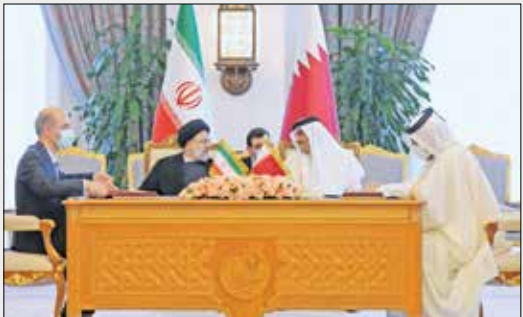
امضای اسناد همکاری در حضور سران