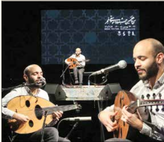
اجرای نوازنده عود از مصر

تئاتر و حتی تجسمی هم بوده است و این عنوان تأثیری در روند جشنواره نخواهد گذاشت و باید این موضوع در اساسنامه آن قید شود. ما باید «برندسازی» کنیم؛ کما اینکه در دنیا هم اتفاق افتاده است و آسامی بسیاری از فستیوال‌ها خود یک برند و نام است، مانند فستیوال وومکس یا کن. نام «فجر» هم خود یک برند است و با همین عنوان باید در دنیا شناخته شود. باید بتوانیم آن اسم را برند یا به دنیا بشناسانیم و در تقویم جشنواره‌ها ثبت شده است. در این زمینه هم عملکرد مدیران می‌تواند کار را هدقمند کند که این نیازمند یک برنامه‌ریزی اساسی و کلان است. باید از افرادی که در این زمینه خبره و کاربلد هستند دعوت شود و اگر تاکید دارم کار باید به‌صورت سیستماتیک انجام بگیرد منظورم این است که یک دبیرخانه دائمی برای بخش بین‌الملل ایجاد شود. این دبیرخانه در طول سال فعالیت داشته و در ارتباط با هنرمندان خارجی باشد به‌صورت سالانه می‌پندند و حتی شاید برای دوسال دیگر، بنابراین اگر می‌خواهیم جشنواره‌ای منسجم داشته باشیم باید چهارچوب مشخصی شکل بگیرد و از هنرمندان دعوت شود و سمت و سوی جشنواره مشخص باشد و این مسائل نیاز به تمهیدات و اتاق فکر دارد. در آخر باز هم تاکید دارم این ظرفیت در جشنواره موسیقی فجر ما وجود دارد اما باید بدرستی هدایت شود.