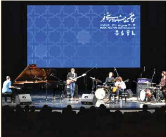
اجرای گروه موسیقی ایتالیایی کوچک