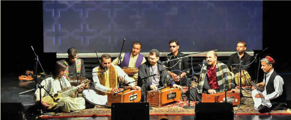
کنسرت گروه فولی نجم الدین از افغانستان