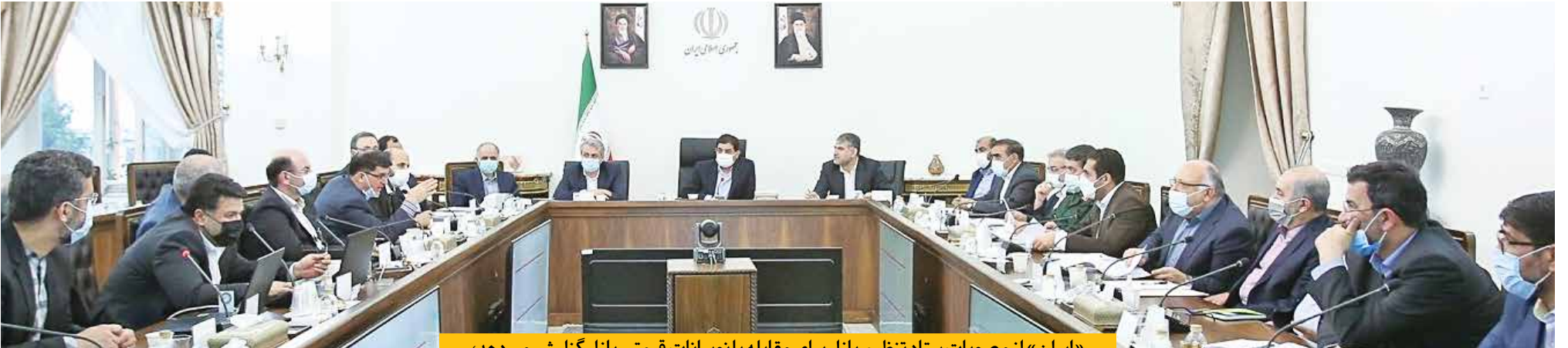
«ایران» از مصوبات ستاد تنظیم بازار برای مقابله با نوسانات قیمتی بازار گزارش می‌دهد؛