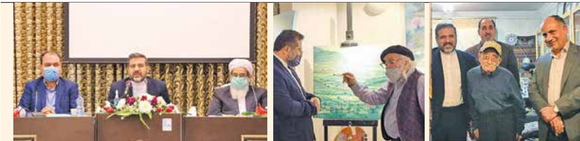
سفر استانی وزیر فرهنگ و ارشاد اسلامی به خراسان رضوی