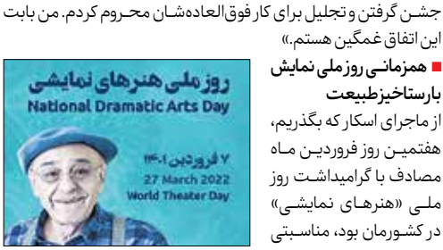
روز ملی هنرهای نمایشی National Dramatic Arts Day

همزمانی روز ملی نمایش با رستاخیز طبیعت از ماجرای اسکار که بگذریم، هفتمین روز فروردین ماه مصادف با گرامی‌داشت روز مشهور «هنرهای نمایشی» در کشورمان بود، مناسبتی تقویمی که برای تئاتر و اهالی‌اش اهمیت بسیاری دارد، چراکه بهانه‌ای است برای پاسداشت فعالان این عرصه و نگاهی به ضرورت‌های تلاش برای ارتقای آن. فرارسیدن این روز ملی با پیام رضا بایگ بازیگر پیشکسوت تئاتر، سینما و تلویزیون همراه بود. این هنرمند کشورمان در پیام خود به نکات مختلفی اشاره کرده بود، از اهمیت و تأثیر فرارسیدن بهار در امیدواری بیشتر به فردهای بهتر گرفته تا همزمانی ایام نوروز با روز ملی هنرهای نمایشی. در بخشی از پیام رضا بایگ آمده بود: «تقارن بهار و تئاتر در روز جهانی و ملی آن در نخستین روزهای رستاخیز طبیعت، فراخواندن انسان به درنگ در هستی و معنای ژرف زندگی است و برای ما که در جشن نوروز، روح و جسم تازه می‌کنیم همان رخ می‌دهد که هربار و به تکرار در تئاتر به خویش یابی، نوزایی و نواندیشی فراخوانده می‌شویم.»