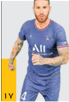
سرنوشت مهم راموس در پاری سن ژرمن