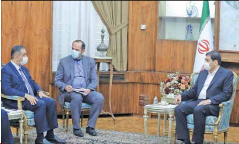
پیکنگ: اطلاع رسانی معاول اول رئیس جمهور

تأکید بر توسعه تعاملات بانکی های مرکزی ایران و عراق معاول اول رئیس جمهور کشورمان بر گسترش و تعمیق بیش از گذشته روابط بین جمهوری اسلامی ایران و جمهوری عراق بویژه در بخش های مالی و