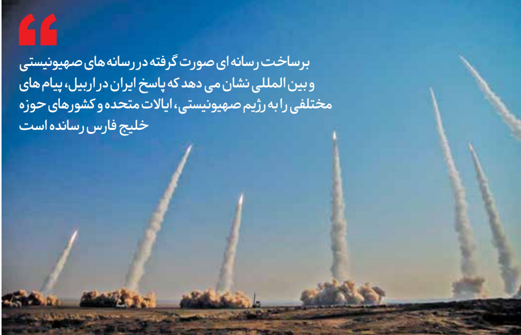
عملیات موشکی مرحله اول آزمایش پیامبر اعظم ۱۵

برساخت رسانه‌ای صورت گرفته در رسانه‌های صهیونیستی و بین‌المللی نشان می‌دهد که پاسخ ایران در اربیل، پیام‌های مختلفی را به رژیم صهیونیستی، ایالات متحده و کشورهای حوزه خلیج فارس رسانده است. ظاهراً ایران راهبرد صبر استراتژیک را در دوره فعلی کنار گذاشته است و پاسخ‌های ایران در کوتاه‌ترین زمان ممکن دریافت خواهد شد. پاسخ ایران هم از لحاظ زمانی، دقت و شدت به گونه‌ای بود که هرگونه اقدام علیه ایران را باید بسیار سنجیده‌تر انجام داد و تمام محاسبات را در نظر گرفت که دیگر دوران جنگ بود که تا پایان آن به دست